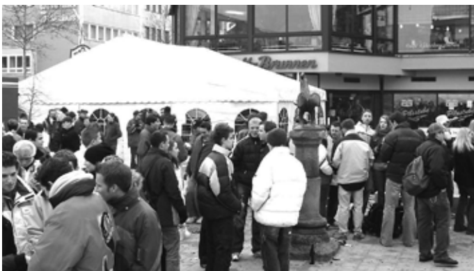
Auch in der Talstraße vor der damaligen „Glockenstube“ herrschte Hochbetrieb (2006)

Gelegentlich präsentieren wir Ihnen ein historisches Foto, das einen besonderen Moment aus der Geschichte unserer Stadt festhält. Es sind Bilder, die uns an prägende Ereignisse, kleine Alltagsgeschichten oder große Veränderungen erinnern, die die Stadt damals, und auch uns, geprägt haben. Manche Fotos mögen längst vergessene Geschichten erzählen, andere