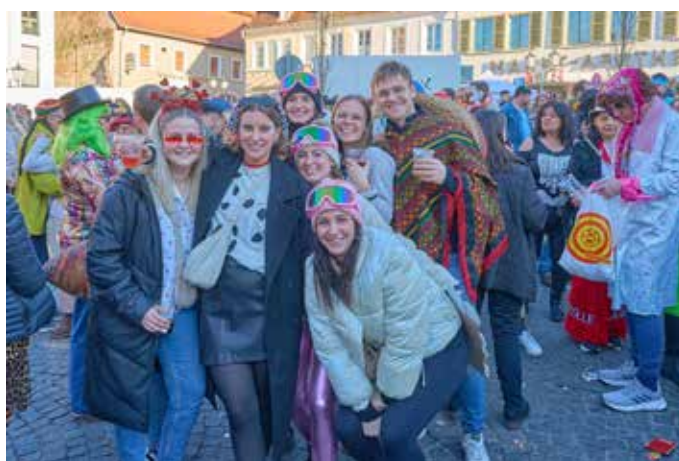
Auch Ski-Kostüme durften nicht fehlen

Marktplatz zum Beben und riss das Publikum mit. Tausende Stimmen sangen mit, und die gesamte Altstadt verwandelte sich in eine riesige Tanzfläche. Teilweise war ein Durchkommen durch die dichten Menschenmengen kaum noch möglich – Homburg bebte im Faschingstaumel! Doch nach dem offiziellen Ende der Marktplatzparty um 18:00 Uhr war noch lange nicht Schluss. Die Feier verlagerte sich nahtlos in die umliegenden Lokale, insbesondere ins Vin!Oh und Oh!lio, wo die Party bis tief in die Nacht weiterging. Auch das Marktgässje und die Cartoon Bar Lounge boten ganztägig von 11:11 bis 22:00 Uhr beste Beats von zwei DJs, die die Stimmung bis zur letzten Minute