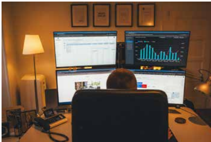
„Mission-Control“ in dem Büro der Homburger Werbeagentur

Online-Marketing, Webdesign und Webentwicklung spezialisiert. Das Unternehmen bietet seinen Kunden ein umfassendes Leistungsspektrum, das von Google Ads und Performance-Marketing über Suchmaschinenoptimierung und Content-Marketing bis hin zu Social Media Marketing reicht. Zudem entwickelt die Agentur individuelle Web-Lösungen