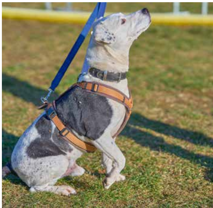
„Findus“, ein Staff-Mix Rüde, ist leider schon seit Juni 2019 im Tierheim. Interesse? Hundevermittlung gerne über E-Mail an: hunde@tierheimhomburg.de