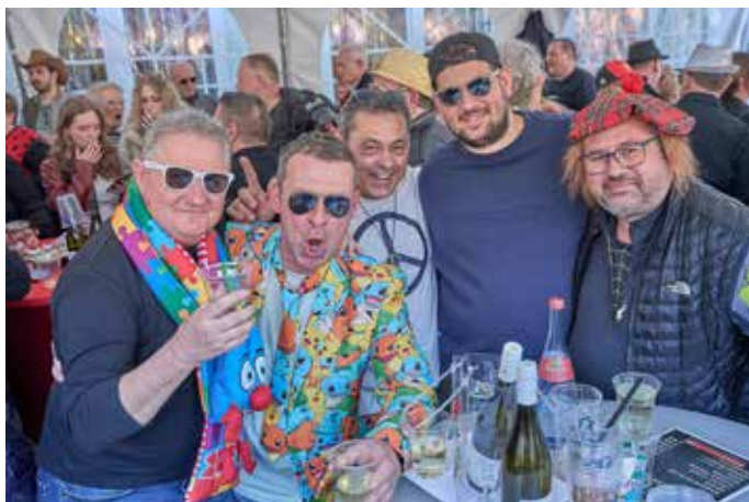
Feiernde im Vinoh!

aufrechterhielten. Neben der musikalischen Unterhaltung sorgten zahlreiche Stände der umliegenden Restaurants mit kulinarischen Köstlichkeiten für das leibliche Wohl der Besucher. Dank eines durchdachten Sicherheitskonzepts verlief die gesamte Veranstaltung reibungslos und ohne besondere Vorkommnisse. Die Närrinnen und Narren konnten unbeschwert feiern und den Fasching in vollen Zügen genießen. Der Rosenmontag in Homburg war zweifellos ein voller Erfolg und wird den Feiernden noch lange in Erinnerung bleiben. Nach diesem grandiosen Fest steigt bereits jetzt die Vorfreude auf das nächste närrische Spektakel in der Stadt. Text: Redaktion