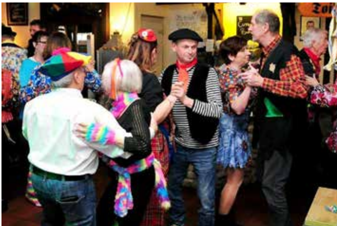
Beim Fasching im Brauhaus wurde munter getanzt