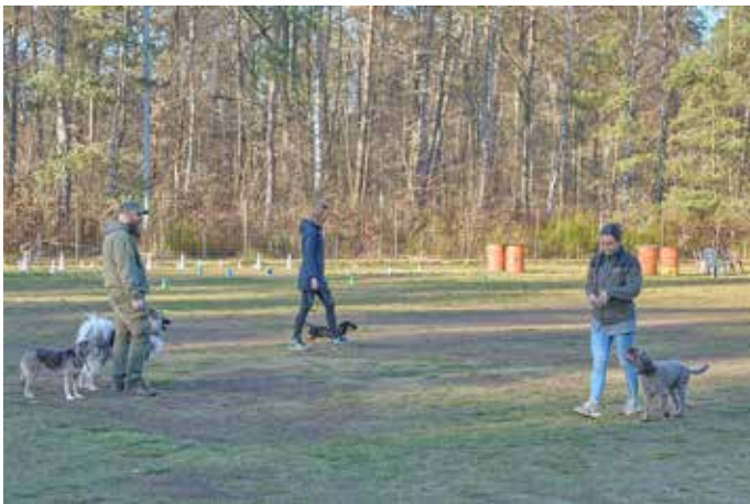
Training auf dem Platz der Hundeschule „Chaoten auf 4 Pfoten“

„Im Grunde kommen täglich Anfragen aus dem ganzen Saarland, ob wir einen Hund annehmen können, jedoch sind unsere Kapazitäten begrenzt. Wir versuchen dann eben auch eher einen „netten“ Hund zum Weitervermitteln anzunehmen“, sagt sie ganz klar. Derzeit existieren im gesamten Saarland vier Tierheime, und zwar in Niederlinxweiler, in Dillingen, in Saarbrücken und in Homburg. „Alle vier sind voll“, sagen im Rahmen des Interviews beinahe alle Anwesenden gleichzeitig. „Und überall sitzen immer mehr Problemhunde“, gibt Thomas zu bedenken. „Hunde sind leider zur Mode geworden. Es ist zum Beispiel „in“, sich einen Herdenschutzhund zu holen und erst