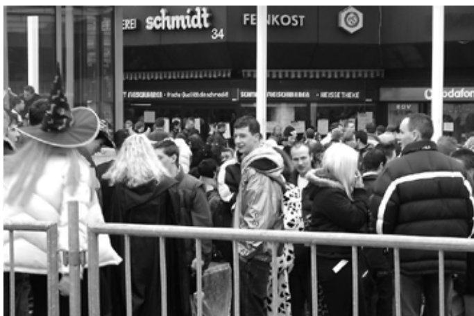
An manchen Stellen gab es kein Durchkommen mehr (2006)

Weil es der Homburger Obrigkeit im Laufe der Jahre dann einfach zu viel wurde mit all dem bunten Treiben, wurde diese Kultveranstaltung abgeschafft.