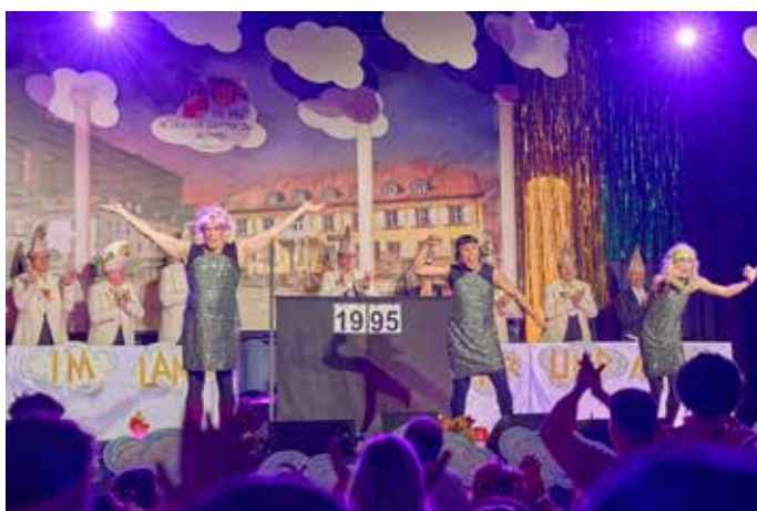
Die Revo Boys brachten mächtig viel Spaß auf die Bühne