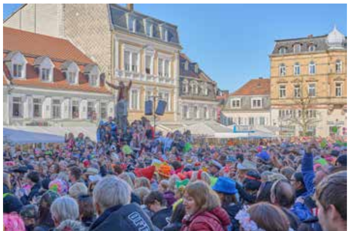
Die tobende Menge auf dem historischen Homburger Marktplatz

Narrenzunft (HNZ) und unterstützt von Dr. Theiss Naturwaren sowie der Homburger Kulturgesellschaft, bot das Event alles, was das Faschingsherz begehrt. Auch das Team von Oh!lio und Vinoh! half tatkräftig bei der Planung und Umsetzung mit. Die