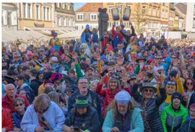
Schätzungen zufolge waren an Rosenmontag 3.000 Menschen auf dem historischen Homburger Marktplatz und Umgebung anwesend