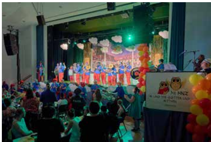
Die Guggemusik Pfälzer Rhythmusfetzter brachten mächtig viel Stimmung in den Saalbau