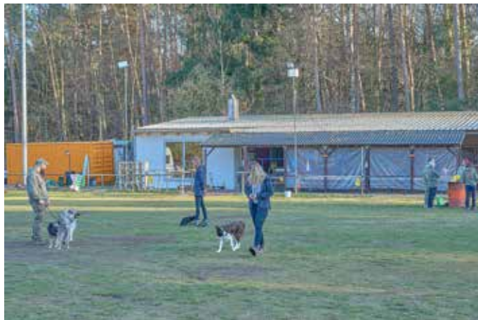
Auf dem Platz der Hundeschule „Chaoten auf 4 Pfoten“