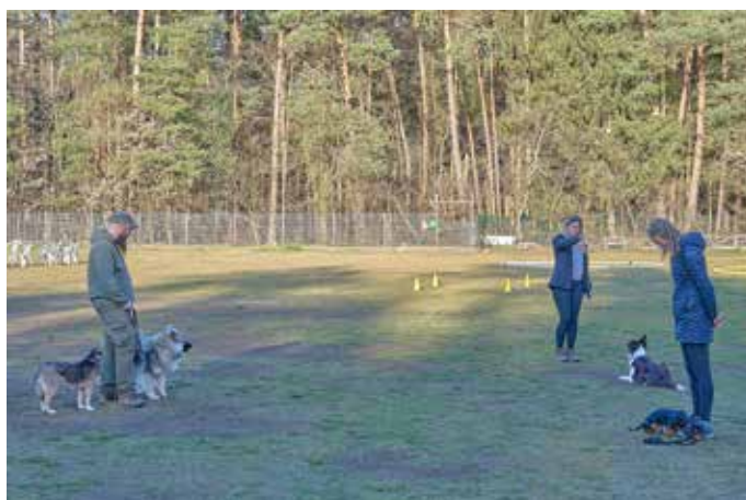
Training erfolgt durch Praxis und das regelmäßige Wiederholen des Gelernten