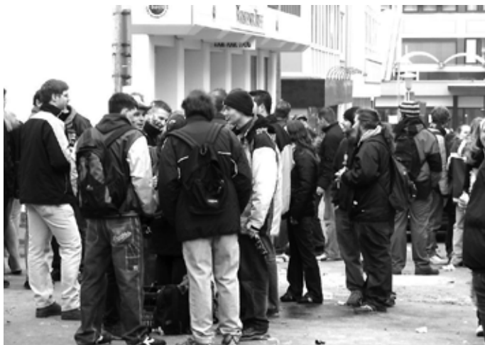
Auch an der Ecke Schanzstraße und Kirchenstraße ging die Post ab (2006)