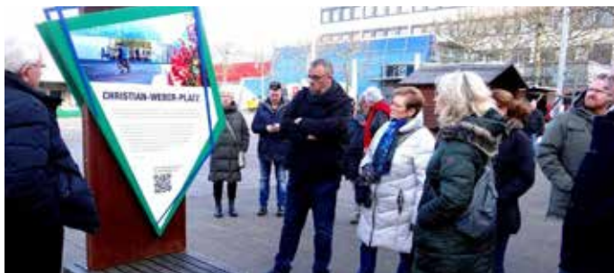
Eine Infotafel am Christian-Weber-Platz erinnert an den Gründer der Karlsberg Brauerei