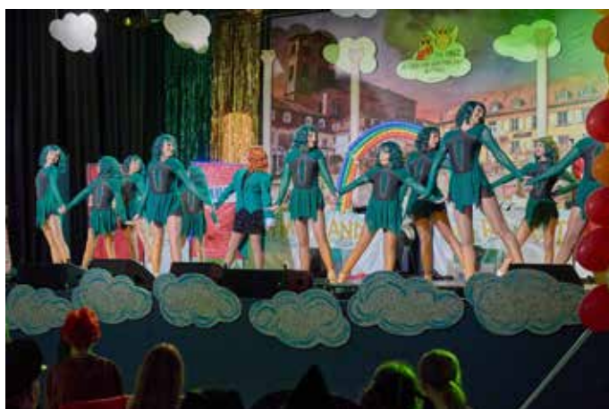
Die Junioren bei ihrem wunderschönen Schautanz