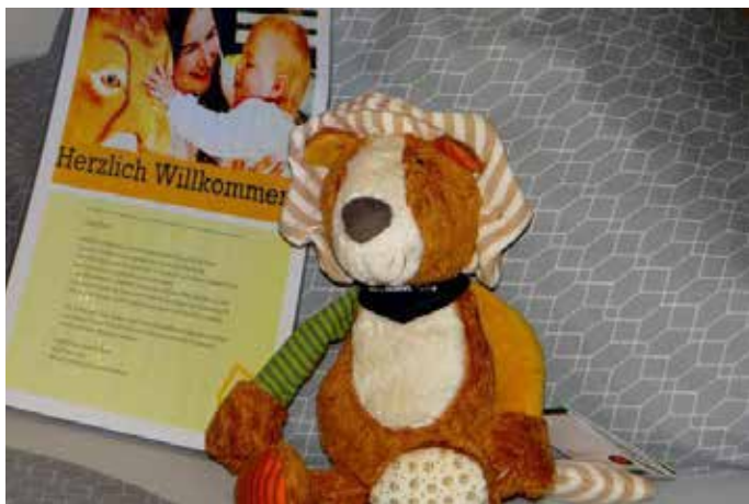
Beim Neubezug eines Apartments wird das jeweilige Kind mit einem „Schmusebär“ auf dem Bett begrüßt