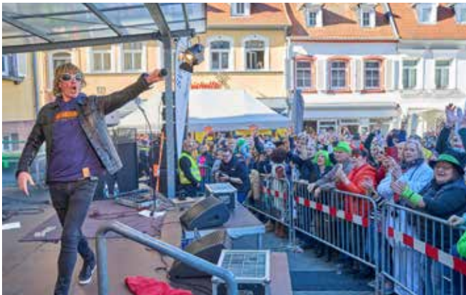
Mickie Krause - Der TOP-Act des Tages

Homburg erlebte einen Rosenmontag voller Lebensfreude und ausgelassener Stimmung. Der historische Marktplatz wurde zur riesigen Partyeile, auf der sich rund 3.000 Närrinnen und Narren versammelten, um gemeinsam die fünfte Jahreszeit zu feiern.