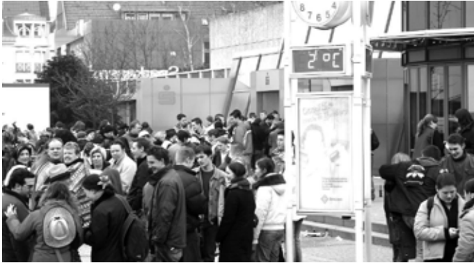
Der Christian-Weber Platz war bis hin zur Sparkasse voll mit feiernden jungen Leuten (2006)