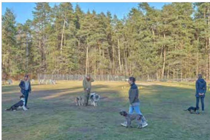
Ein gutes Miteinander ist wichtig: Hund mit Frauchen/ Herrchen, sowie Hund mit anderen Hunden