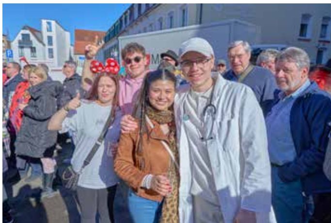
Gute Stimmung in vielen Gesichtern