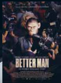
Better Man - Die Robbie Williams Story FSK 0 | 131 min