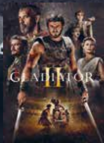
Gladiator 2 FSK 16 | 148 min | 2D

3x2 FREIKARTEN ZU GEWINNEN!! für einen Film nach Wahl