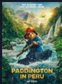
Paddington in Peru FSK -