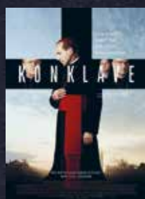
Konklave FSK 6 | 120 min | 2D