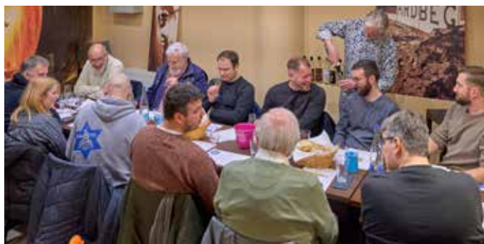
Am Abend des Tastings „Whisky(e)s weltweit“

Sonderöffnungszeiten des Ladens in der Marktstraße 9 sind am 23.12. von 9:00-18:30 Uhr und an Heiligabend, dem 24.12. von 9:00-14:00 Uhr. Ab kommenden Jahres wird das Geschäft donnerstags, freitag und samstags geöffnet sein. Aktuell gibt es zum Beispiel besondere Whiskys der absoluten Extraklasse, wie die Highland Park „Fire & Ice Edition“ mit 15 und 17 Jahre Fassreifung und die Ardbeg-Sondereditionen „BizarreBQ“, „Heavy Vapours“, „Anthology“ (13 sowie 14 Jahre) und den „Traigh Bhan (19 Jahre)“ (siehe Bilder).