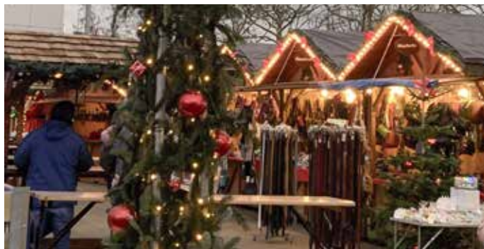
Stimmungsvolle Weihnachtsstände mit handgefertigten Waren und weihnachtlichen Köstlichkeiten, die die Besucher zum Stöbern und Genießen einladen.