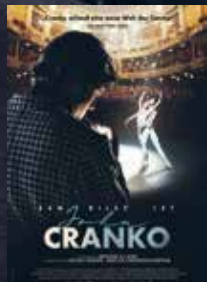
Cranko FSK 12 | 133 min | 2D