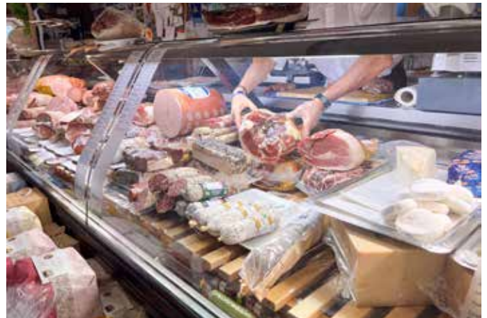
Nur die feinste Auswahl an frischer Feinkost

Gegebenheiten stammt, naturbelassen, luftgetrocknet und mindestens 18 Monate gereift ist, bekommt das unverkennbare Gütesiegel, die fünfzackige Herzogskrone, eingebrannt. Im Jahr 2022 wurden rund 8 Millionen Parmaschinken hergestellt, von denen 33 Prozent in den Export gingen. Deutschland gehört dabei zu den Hauptabsatzmärkten. Um den Parmaschinken weltweit zu schützen, seine Tradition zu bewahren und das