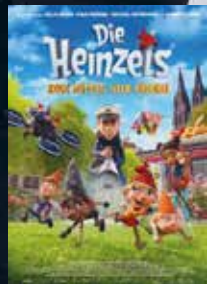
Die Heinzels 2 - Neue Mützen, neue Mission FSK 0