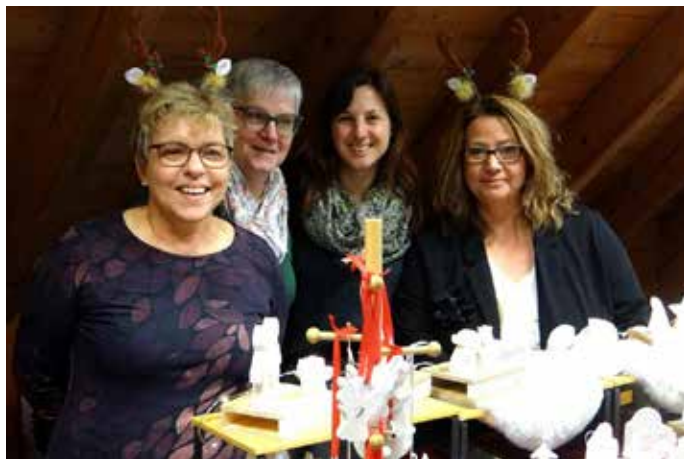
Diese Ausstellerinnen hatten sichtlich Freude bei ihrer Teilnahme am Beeder Adventsmarkt