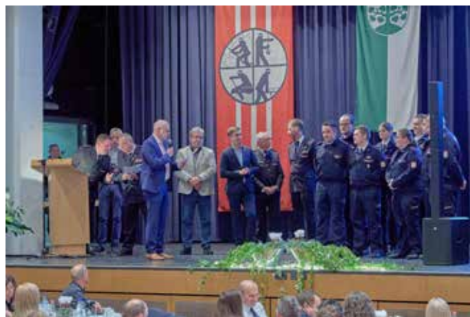
Die junge Generation wird hier geehrt

dieser guten Leute werden im Anschluss an diesen Text der Vollständigkeit halber und wegen des damit verbundenen gebührenden Respekts aufgelistet. Angesichts dessen, war es schon irgendwie eine Art „Galaabend“, denn die vielen Anwesenden stellten in ihren schmucken Uniformen auch echte Hingucker dar. Der stellvertretende Wehrführer Udo Eckhardt