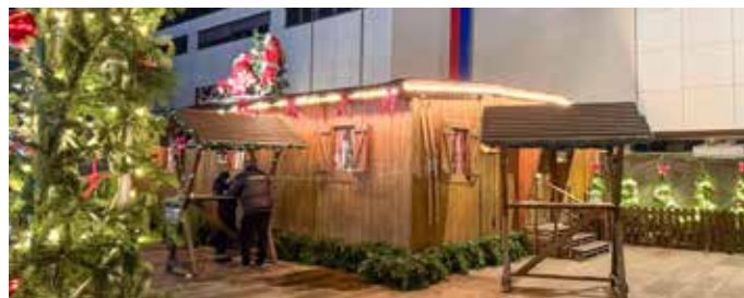
Die Alm lädt zu langen Après-Ski Partys ein.

eine besondere Atmosphäre. Von stimmungsvollen Konzerten bis hin zu faszinierenden Eisrevuen und Lichtfesten ist für abwechslungsreiche Unterhaltung gesorgt. Das Weihnachtsdorf hat großzügige Öffnungszeiten, die viel Zeit für einen Besuch lassen. Von Montag bis Mittwoch ist es von 11:00 bis 21:00 Uhr geöffnet, während es von Donnerstag bis Samstag sogar bis 22:00 Uhr zugänglich ist. An Sonntagen können Besucher das