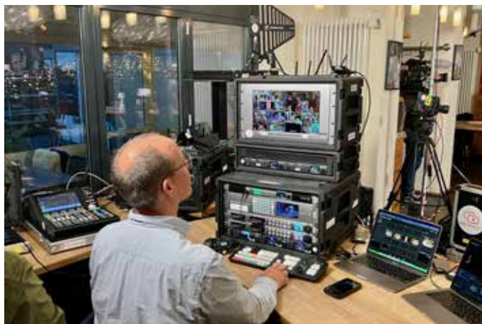
Ein Blick auf die sehr interessante Technik im Hintergrund des Live-Streams

ich mich dafür einsetzen würde, war ich sofort bereit dazu! Man sollte die Kinderinsel und die medizinische Grundversorgung, sowie eine exzellente Betreuung und Medizin für den Patienten unterstützen, denn Kinder sind unsere Zukunft. Spenden, die von außen kommen sind immens wichtig und da zählt jede Art von Engagement.“ Nach dem Verzieren der leckeren Plätzchen