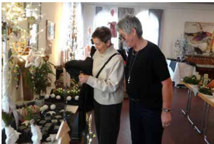
Die Besucher konnten in eine Welt eintauchen mit liebevoll arrangierten handgefertigten Weihnachtsdekorationen

dieser schönen Atmosphäre präsentierten Hobbyaussteller ihr vielfältiges Angebot. So konnten Bilder aus Moos und Naturmaterialien, Klöppelkunst, selbstgenähte Kinderkleidung, Stricksachen und Häkelkunst, Karten, Papierobjekte, Makramee Arbeiten, Metall- und Holzkunst Weihnachtselemente aller Art für drinnen und draußen, Schmuck aus Silber und Halbedelsteinen und Vieles mehr erworben werden. Wie