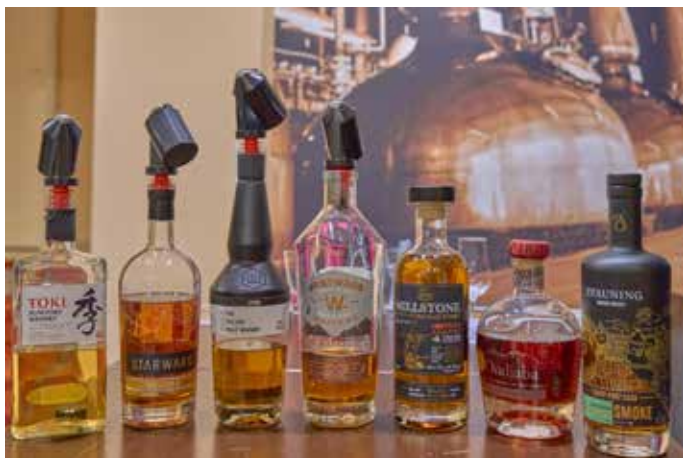
Die Whiskys beim Tastingabend „Whisky WELTWEIT“ im November

Adventskalender“-Verkaufsaktion seit Oktober/November kam sehr gut bei den Fans in der Homburger Whiskyszene an und war erneut ein Verkaufserfolg. Denken auch Sie daran, dass KaJu’s Genusswelt immer eine gute Adresse für Last-Minute-Geschenke gerade für Weihnachten ist. Spezielle diesbezügliche