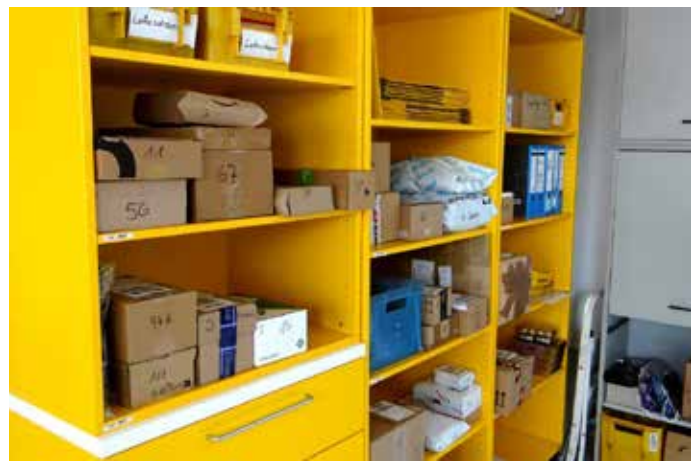
Neben neuen Postmöbeln im Kundenbereich wurde der Nebenraum mit neuen Regalen ausgestattet, zur Verbesserung der Lagerkapazität