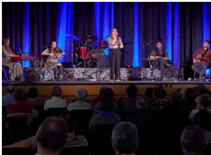
Hier zu sehen: Die Band „3 on the bund“

Süden. Vier mal spielen wir dann in der Schweiz, bevor es wieder hoch geht in den Norden.“ Er schmunzelt und gibt zu verstehen, dass er nun als Rentner mal andere Wege gehen wollte; kurzerhand sich einfach als Busfahrer dieser Truppe bewarb und da er Irland und die irische Musik liebe, sei das alles perfekt für ihn gelaufen! Die Soundtechnikerin Catherine Cullman am Mischpult ist nun 5 Jahre dabei und sagt über