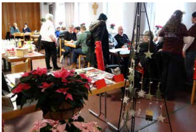
Bei Kaffee und Kuchen oder heißer Gulaschsuppe konnte man es sich im Sitzbereich gemütlich machen

So konnten die Besucher in eine Welt eintauchen mit liebevoll arrangierten handgefertigten Weihnachtsaccessoires. In