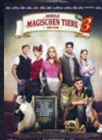
Die Schule der magischen Tiere 3 FSK 0 | 105 min | 2D