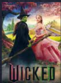
Wicked FSK 6 | 161 min