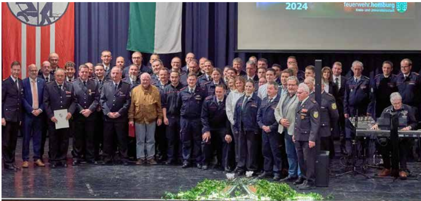
Gruppenabschlussbild von der Empore aus aufgenommen