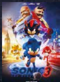
Sonic The Hedgehog 3 FSK - | 109 min