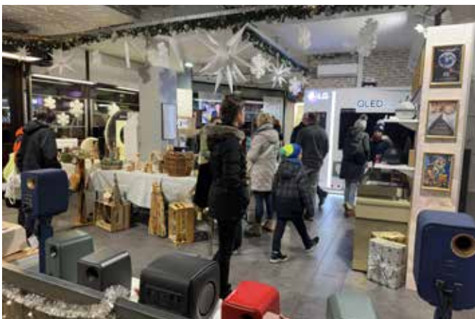
Bei leckere Crêpes und hausgemachten Glühwein verweilten die Kunden gerne in den Ausstellungsräumen von Ulmcke Hifi

Der Audio- und Video-Fachhändler Ulmcke Hifi feierte am 1. Dezember sein 45-jähriges Jubiläum mit einem weihnachtlichen Fest. Zahlreiche Besucher genossen Glühwein, Crêpes und Kaffeespezialitäten, während ein 450-Euro-Einkaufsgutschein als besonderes Highlight verlost wurde.