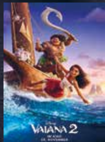
Vaiana 2 FSK 0 | 99 min | 2D, 3D