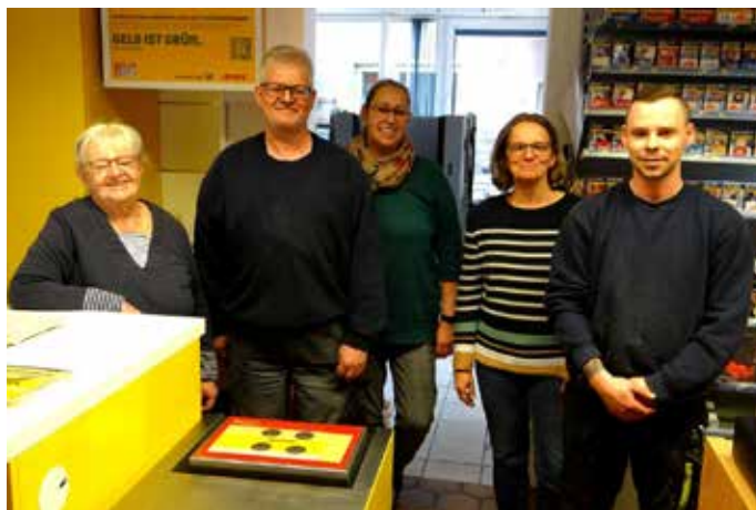
Der Laden in der Blieskasteler Straße 110 mit Poststelle, Toto- und Lottoannahmestelle, Schreibwaren, Tabakwaren, Geschenkartikeln und einem Bereich mit Produkten aus der Biosphäre Bliesgau.