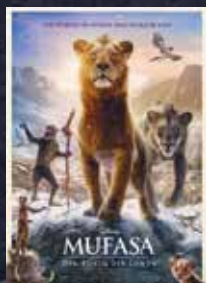
Mufasa: Der König der Löwen FSK 6 | 118 min