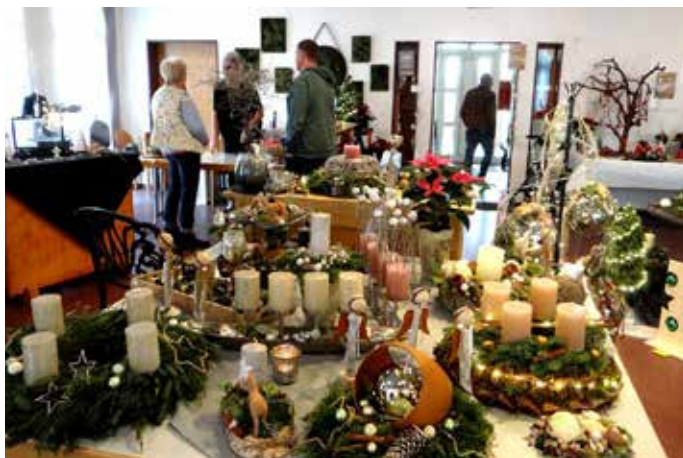
Beim Adventsmarkt in Beeden verband sich eine festliche Atmosphäre der Vorweihnachtszeit mit eindrucksvollem handwerklichen Geschick der Ausstellerinnen und Aussteller

dieser schönen Atmosphäre präsentierten Hobbyaussteller ihr vielfältiges Angebot. So konnten Bilder aus Moos und Naturmaterialien, Klöppelkunst, selbstgenähte Kinderkleidung, Stricksachen und Häkelkunst, Karten, Papierobjekte, Makramee Arbeiten, Metall- und Holzkunst Weihnachtselemente aller Art für drinnen und draußen, Schmuck aus Silber und Halbedelsteinen und Vieles mehr erworben werden. Wie