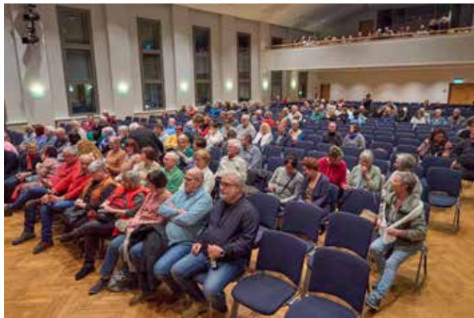
Das Publikum in der Pause