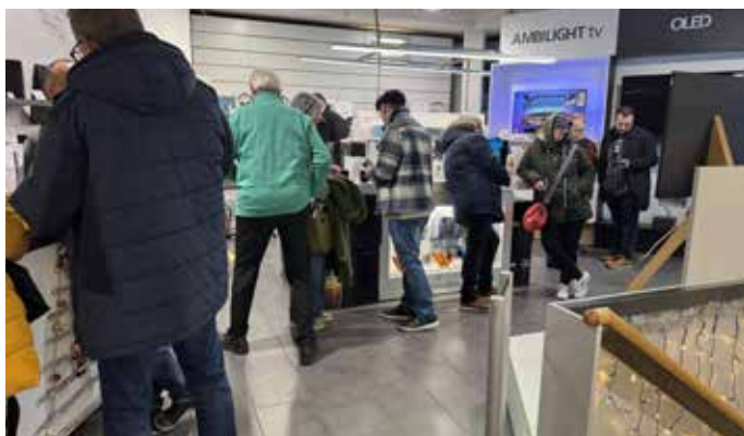
Kunden & Kundinnen am verkaufsoffenen Sonntag bei Ulmcke Hifi

An allen Adventssonntagen hat Ulmcke Hifi bis 18 Uhr geöffnet und lädt weiterhin zu hausgemachtem Glühwein beim Besuch der Ausstellungsräume ein.