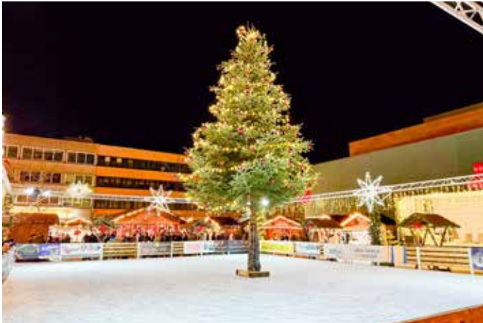
Die eindrucksvolle Eisarena mit ihrem festlich beleuchteten Weihnachtsbaum als Mittelpunkt – ein Highlight für alle Besucher.

Das Homburger Weihnachtsdorf lädt in diesem Jahr vom 8. bis zum 30. Dezember zu einem zauberhaften Besuch auf dem Christian-Weber-Platz ein. Täglich verwandelt sich das Zentrum der Stadt in eine festliche Winterlandschaft,