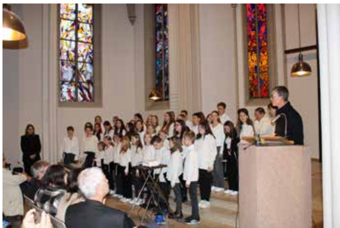
Der Chor des Saarpfalz-Gymnasiums unterstützte die Veranstaltung