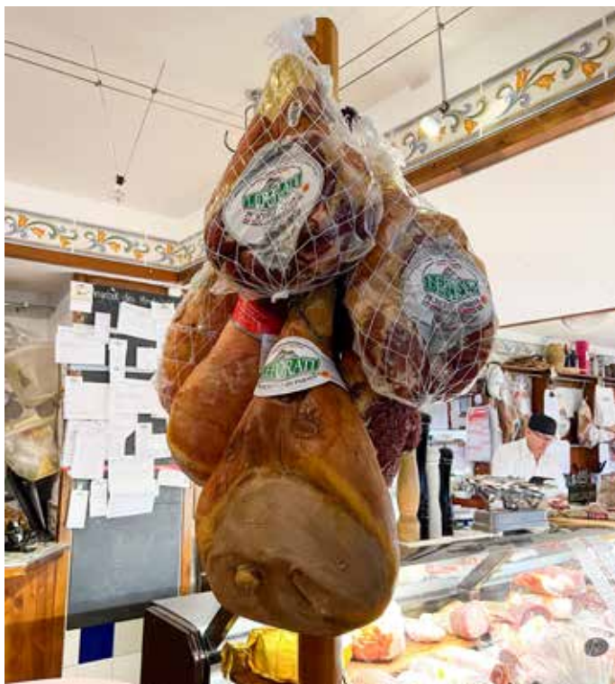
Alle Parmaschinken sind mehr als 18 Monate gereift

Image der Marke zu fördern, wurde im Jahr 1963 das Consorzio del Prosciutto di Parma gegründet, das jedes Jahr aufs Neue ausgewählte Fach- und Feinkosthändler auszeichnet. Die renommierte Jury, der sowohl Vertreter des Herstellers selbst als auch Repräsentanten des Verbandes angehören, beurteilt dabei unter anderem Kriterien wie Expertise und Kompetenz der Fachhändler, Engagement sowie die optische Darstellung des Schinkens in der Bedientheke. Es geht dabei um Leidenschaft, Liebe zu guter Qualität und das tiefe Verständnis für die Besonderheiten dieses Traditionsproduktes. All das und noch viel mehr konnte die Jury bei einem Vor-Ort-Besuch