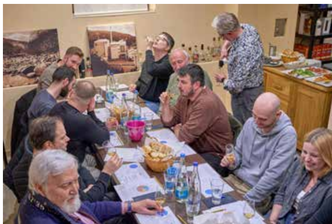
Typische Impressionen bei einem Tasting

Karlstraße 2 · 66424 Homburg · 06841/67722 www.peter-zimmer-osteopathie.de