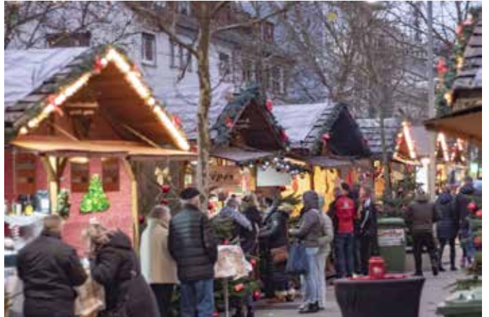
Liebevoll geschmückte Stände im Homburger Weihnachtsdorf, umgeben von funkelnden Lichtern und weihnachtlicher Dekoration – hier beginnt der Zauber.

die täglich zum Schlittschuhlaufen einlädt. Wer keine eigenen Schlittschuhe besitzt, kann sich diese vor Ort ausleihen. Kinder profitieren von Sturzhelmen und süßen Pinguin-Laufhilfen, die ihre ersten Schritte auf dem Eis erleichtern. Für gesellige Abende sorgt die „ALM“, eine urige Hütte im Stil eines Skirestaurants. Hier kann man die einzigartige Atmosphäre bei heißen Getränken genießen und an den legendären