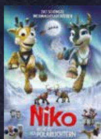
Niko - Reise zu den Polarlichtern FSK 0 | 85 min | 2D