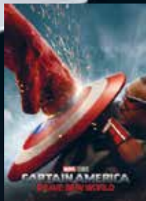
Captain America: Brave New World FSK -