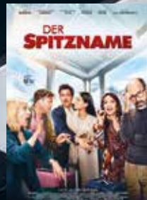
Der Spitzname FSK 6 | 89 min