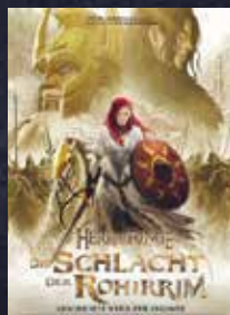
Der Herr der Ringe: Die Schlacht der Rohirrim FSK 12 | 134 min