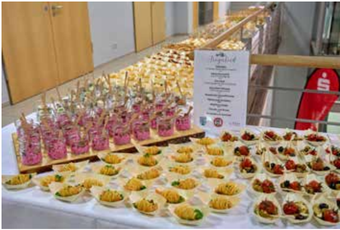
Das Fingerfood-Buffer - gewohnt exquisit vom Hotel Stadt Homburg