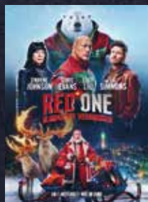
Red One - Alarmstufe Weihnachten FSK 12 | 123 min | 2D

3x2 FREIKARTEN ZU GEWINNEN!! für einen Film nach Wahl