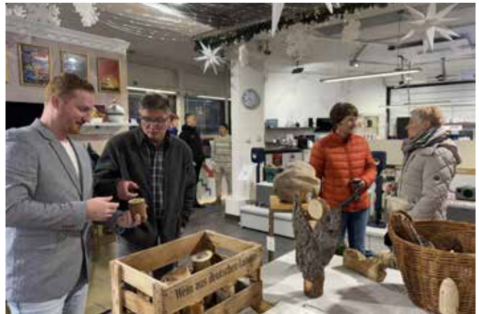
Ausstellung weihnachtlicher Naturdecoration von Wiesen-Stern bei Ulmcke Hifi