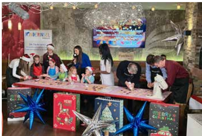
Fleißig werden die frisch gebackenen Plätzchen verziert

„Die Kinderklinik betreut zunächst einmal jeden kranke Kind, aber als einzige Uni-Klinik im großen Umkreis sind wir auch Anlaufstation für viele schwerkranke und chronisch kranke Kinder aus dem Umkreis von über 100 km. Die Kinderklinik ist in den vergangenen Jahren sehr stark gewachsen, leider jedoch nicht von den Räumlichkeiten her, denn das Gebäude wurde 1996 gebaut und platzt inzwischen aufgrund des Zuwachses an kranken Kindern fast aus den Nähten. Wir sind unfassbar