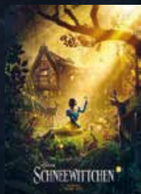
Schneewittchen FSK -