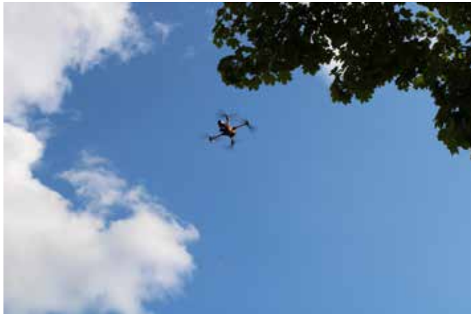
In 120 m Höhe „parkte“ die Drohne