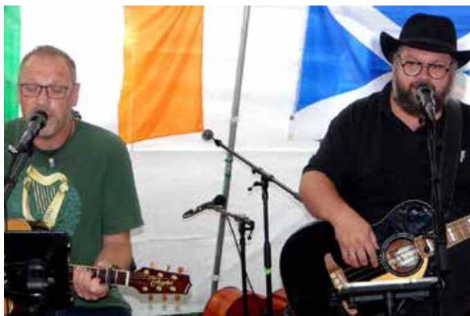
Irische Melodien und Folk-Songs, mal lebhaft und fröhlich oder melancholisch und nachdenklich spiegelten die Seele Irlands wider

Der jährliche irische Frühschoppen in der Dorfmitte von Schwarzenbach unter mächtigen Nussbäumen, ist immer wieder eine Erfahrung, die alle Sinne anspricht. Unter dem schützenden Blätterdach der Bäume versammelten sich auch diesmal nicht nur Dorfbewohner, um die traditionelle irische Kultur in ihrer ganzen Pracht zu feiern.