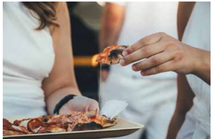
Feinste Pizza vom Oh!lio Foodtruck

66424 Homburg-Beeden ♦ Blieskasteler Straße 110