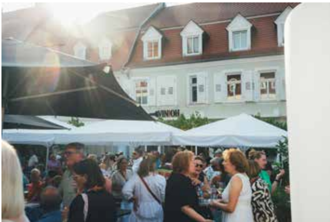
Sommerstimmung am Freitagabend vor dem Vinloh

nicht kommen sehen. Umso schöner ist es, die Entwicklung zu beobachten, die der historische Marktplatz in Homburg seitdem durchlaufen hat. Die Menge an Laufkundschaft ist um ein Vielfaches gestiegen, der Markt ist zu einem Ort geworden, an dem man gerne sitzen und verweilen möchte, tagtäglich herrscht reges Treiben, was sich nicht zuletzt auch positiv für die Geschäfte der Eisenbahnstraße sowie der Saarbrücker Straße