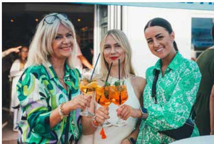
Cheers! Auf eine schöne Eröffnungsparty

Das Restaurant erstrahlt in einem neuen, maritimen Look, der perfekt zur idyllischen Seelandschaft des Campingplatzes passt. Gäste können von der Terrasse aus den traumhaften Blick auf den See genießen und die entspannte Atmosphäre der Natur erleben. Ein besonderer Vorteil: Besucher des Restaurants erhalten kostenfreien Zugang zum Campingplatz, was normalerweise nicht der Fall ist. Dies macht einen Besuch noch attraktiver und lädt zu langen Sommerabenden auf der wunderschönen Seeterrasse ein. Die gastronomischen Angebote von Carola Jank sind nicht nur für Camper interessant. Das Restaurant bietet eine perfekte Location für