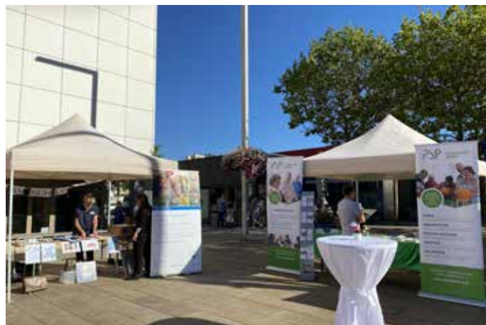
Kommen Sie gerne vorbei und informieren Sie sich

Das gerontopsychiatrische Netzwerk mit Schwerpunkt Demenz im Saarpfalz-Kreis unter der Federführung der Psychosozialen Projekte Saarpfalz in Kooperation mit der Landesfachstelle Demenz Saarland veranstaltet am 10.09.2024 im Monat des Weltzheimerntages auf dem Christian-Weber-Platz erneut einen „Memory Walk“ d.h. einen Infotag rund um das Thema „Demenz“ sowie einen verbalen „Erinnerungsspaziergang durch die Stadt“. Ein Stadtführer wird auf dem Christian-Weber-Platz über die Geschichte von Homburg erzählen.