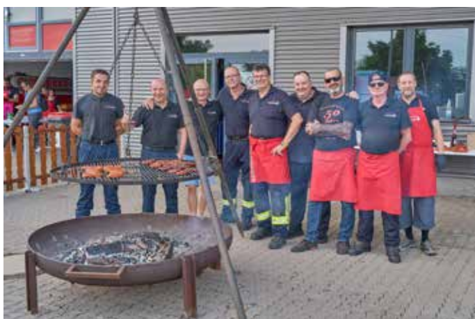
Echte Männer der Homburger Feuerwehr am Grill