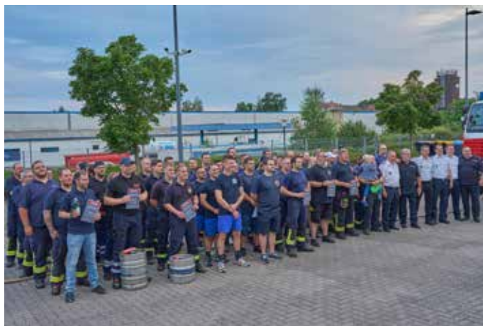
„Firetruck-Pulling“ - Abschlussbild aller beteiligten Gruppen

Innenstadt, Hochwälder Plus Bus, GAL 2023, FF Waldmohr, FF Bexbach-Mitte, FF Schopp, Neunkirchen-5 FF Wellesweiler, FF Höchen und auch die Rettungswache Homburg. In zwei Läufen konnten sich von den zehn Teams für die Finalrunde die drei Teams FF Reinheim, FF Saarlouis-Innenstadt und Hochwälder Plus Bus als Finalisten qualifizieren. Im Finale dann war es sehr, sehr knapp. Mit einem Unterschied von