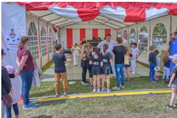
Das Zelt vom Judo Kenshi Homburg-Erbach e.V.

und Funsportclub Saar-Pfalz e.V., die Stadtwerke Homburg, die Kreissparkasse Saarpfalz, die Saarland Versicherungen, die LBS-Bausparkasse, die Bank1Saar und der SR1 mit einer kleinen Jugendbühne, auf der „DJ Lorenzo“ vom Jugendbeirat der Stadt Homburg auflegte. Daneben betrieb der Jugendbeirat eine alkoholfreie Cocktailbar. Das Angebot war insgesamt so umfassend, dass es uns hier nicht möglich ist, allen Beteiligten gerecht zu werden, beziehungsweise diese hier namentlich zu erwähnen; wir bitten daher um Entschuldigung, sollten wir jemanden vergessen haben. Die vielfältigen kostenlosen Mitmachangebote in den Bereichen „Kreativ“, „Sport“ sowie „Natur & Umwelt“ boten den Stadtparkgästen sieben Stunden lang ein überaus buntes, spannendes als auch lehrreiches Programm. Wer Pause machen wollte, konnten sich auf den beiden Bühnen die dort gebotenen Programme anschauen oder