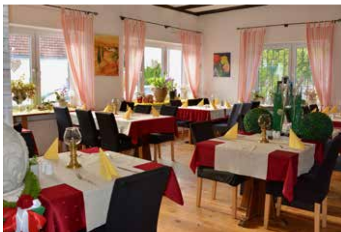
Der schön eingerichtete Nebenraum ist bestens geeignet für Ihre privaten Feiern

Flusskrebse oder auch die überbackenen Gerichte wie Lasagne oder die Combination. Auf der Speisekarte finden Sie zudem Rumpsteak-Variationen, die ausschließlich vom Irish-Roastbeef stammen. Lust auf noch mehr Fleisch? Vom Scaloppine Veronese über Saltimbocca alla Romana bis zu der Parmigiana, Involtini alla Romana und Valdostand finden