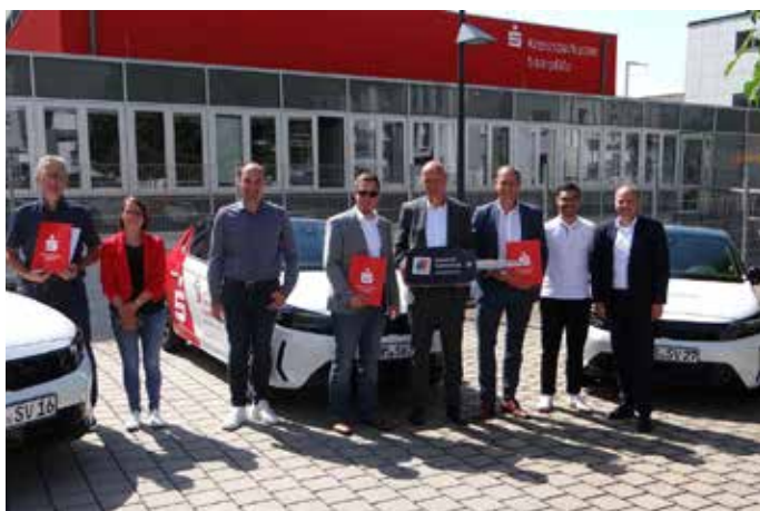
Drei gemeinnützige Einrichtungen aus der Region erhielten von der KSK Saarpfalz jeweils einen neuen Opel Corsa

Das Gewinnsparen stellt eine gelungene Verbindung zwischen finanzieller Vorsorge und sozialem Engagement dar. Die Aktion ermöglicht es den Teilnehmern, regelmäßig einen festen Betrag zu sparen und gleichzeitig die Chance auf attraktive Gewinne zu haben. Ein Teil des gesparten Betrags wird dabei in gemeinnützige Projekte investiert. Die Übergabe der Autos ist ein sichtbares Zeichen dieser Unterstützung und soll die