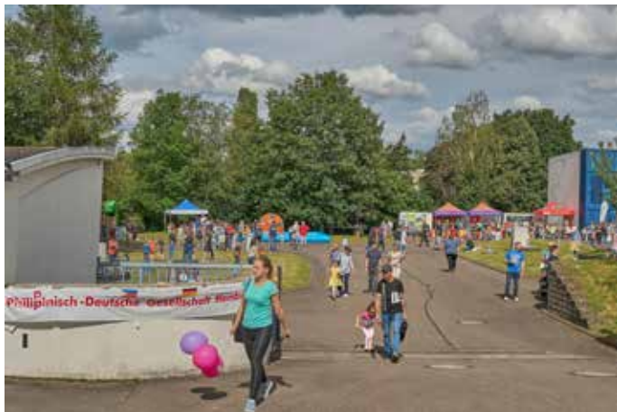
Die Stadtwerke Homburg stellten das Areal am Wasserwerk in der Brunnenstraße als Veranstaltungsfläche zur Verfügung

Buttonmaschine, das Römermuseum Schwarzenacker, die AWO, der 1. Juggerclub Saar-Pfalz e.V., der FC 08 Homburg, der Förderverein Handballjugend, Judo Kenshi Homburg-Erbach e.V., die Jugendfeuerwehr Homburg-Mitte, Jumpers Fitness Homburg, Lady Fitness und Gesundheit, die Malteser Homburg, der Rotary-Club Homburg-Zweibrücken, das Landespolizeipräsidium, Saarkult e.V. mit Kinderschminken, der THW Homburg, die Saarpfalz-Celtics (Footballer), der Trend-