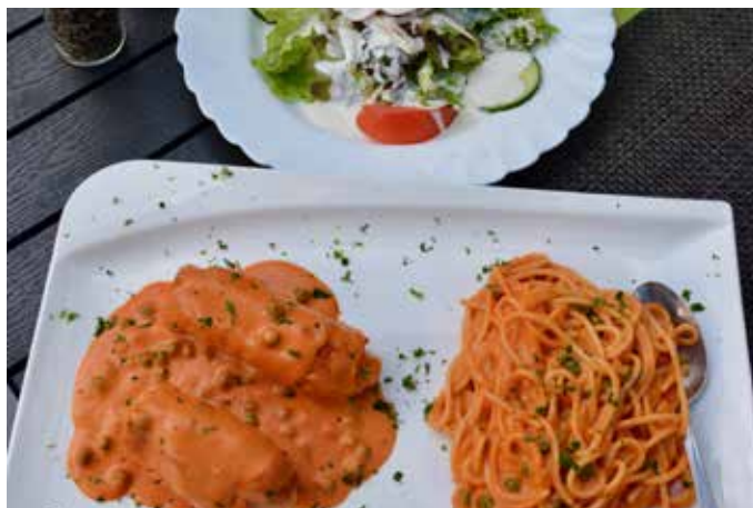
Ein Gedicht sind die Fleischgerichte mit fantastischen Soßen und frischem Salat

Flusskrebse oder auch die überbackenen Gerichte wie Lasagne oder die Combination. Auf der Speisekarte finden Sie zudem Rumpsteak-Variationen, die ausschließlich vom Irish-Roastbeef stammen. Lust auf noch mehr Fleisch? Vom Scaloppine Veronese über Saltimbocca alla Romana bis zu der Parmigiana, Involtini alla Romana und Valdostand finden