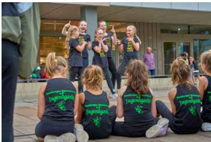
Einfach klasse: Die Jugendgarde der HNZ (Homburger Narrenzunft e.V.)