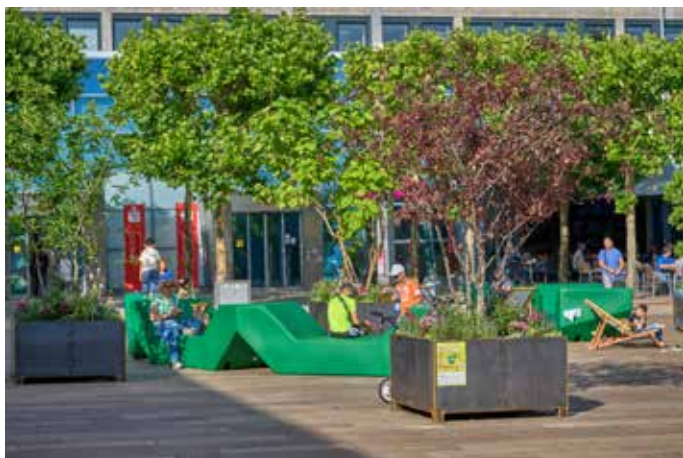
Grüne Bäumchen geben dezent Schatten - was will man mehr?

Oberbürgermeister die mobile „Kukuk-Box“ mit Möblierung, den Pflanzkübeln und allem drumherum auf dem Homburger Christian-Weber-Platz. Glückwunsch an dieser Stelle von der bagatelle! Manche Homburger dürften sich im Vorfeld ob der aufgestellten riesenhaften grünen „Plastikcouchen“ etwas mokiert haben. Sei's drum: Mit den aktuell aufgestellten Pflanzen, den Schatten spendenden Bäumchen und den gemütlichen Strandliegestühlen dürfte jetzt mit dem mobilen Spielplatz auch der letzte verstanden haben, dass die aus Fördergeldern bezahlten Einrichtungsgegenstände auf dem Christian-Weber-Platz allesamt zum Wohle und zum Vergnügen sowie einer spannenden Aufenthaltsqualität der Bevölkerung beitragen