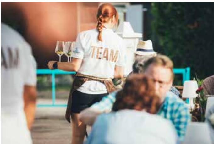
Das Team von TINYS sucht noch Verstärkung! © Mathias Blum