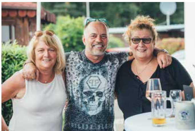
Lächelnde Gesichter, bei der Party