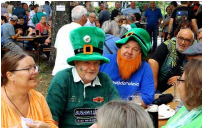
Viele Gäste brachten ihre Liebe zu Irland mit einem entsprechenden Outfit zum Ausdruck

Denn wenn der Obst- und Gartenbauverein Schwarzenbach zum „Irischen Frühschoppen“ einlädt, dann ist Hochbetrieb angesagt. So war es auch diesmal. In der Erikastraße und in den angrenzenden Nebenstraßen war kaum noch ein Parkplatz zu finden. Wer nicht rechtzeitig zur Eröffnung um 11 Uhr da war, musste sich auf eine lange Parkplatzsuche einstellen. Schon rechtzeitig zum Auftakt des Festes mit der Gruppe „The Fenians“ waren fast alle Plätze belegt. Mit irischen Melodien und Folk-Songs, wusste die Band die große Besucherschar bestens zu unterhalten und forderte auch zum Tanz auf der Platzmitte auf. Die Klänge von Fiddle, Tin Whistle, Uilleann Pipes und Bodhrán erfüllten den Platz mit einer Energie, die die Zuhörer unweigerlich mitgerissen hat. Die irische Musik, ob lebhaft und fröhlich oder melancholisch und nachdenklich, erzählt Geschichten von Liebe, Verlust, Freude und Hoffnung – Geschichten, die die Seele Irlands widerspiegeln. Natürlich durften auch die typischen irischen Getränke nicht fehlen. Guinness, Kilkenny und Irish Cider waren so recht nach dem Geschmack der Gäste. Der Moment, in dem in Irland das erste