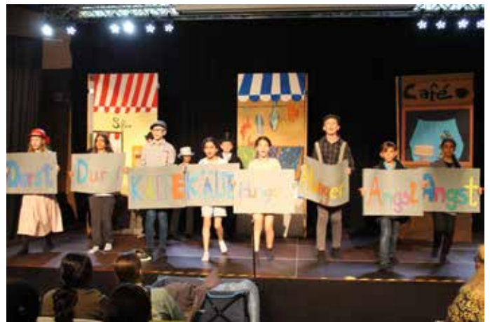
Die Musical-Arbeitsgemeinschaft zeigte eine großartige Vorstellung

Kurz vor Schuljahresende war es endlich soweit. Die Musical-Arbeitsgemeinschaft des Mannlich-Gymnasiums präsentierte die ROTE ZORA, eine Geschichte über Freundschaft und Gerechtigkeit.