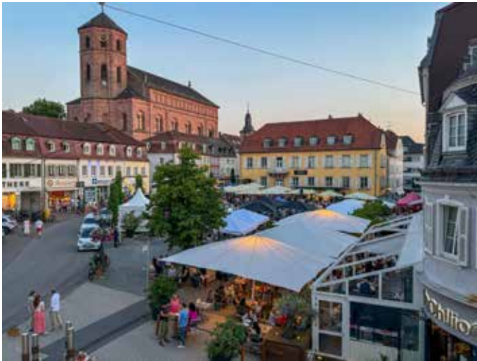
Der Marktplatz ist zu einem wunderschönen und belebten Ort geworden

den Homburgerinnen und Homburgern gut ankommt. Auch das jährlich stattfindende Weinfest mit Livemusik von Elmar Federkeil ist immer gut frequentiert. Darüber hinaus kann das Vin!oh auch für private Veranstaltungen, wie etwa Geburtstage oder andere Feierlichkeiten gemietet werden; Service und Verpflegung inklusive. Neben dem Genuss spielt auch die Kultur am historischen Marktplatz eine zentrale Rolle. So gibt es seit über zwanzig Jahren den Homburger Musiksommer, der sich, auch über die Grenzen der Stadt hinaus, großer Beliebtheit erfreut. Jedes Jahr sind hier an den Wochenenden von Ende Mai bis Anfang September musikalische Klänge unterschiedlichster Stilrichtungen zu vernehmen. Für das leibliche Wohl der Besucher sorgten dabei viele Jahre lang das spanische Restaurant Don Quichotte und ein Getränkewagen. Heute dürfen sich die Gäste auch über frisch zubereitete Pinsa, eine Art Pizzabrot, das nach dem Backen erst belegt wird, freuen, denn das Oh!lio Team ist während des Musiksommers jeden Freitag ab 18.00 Uhr mit Pinsa-Wagen und Getränkezelt vor Ort. Dass die Küche des Restaurants bis 22.00 Uhr geöffnet hat, freut dabei nicht nur die Besucher*innen des Musiksommers, sondern bietet