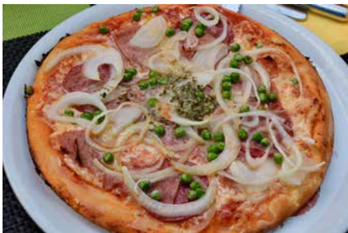
Frisch zubereitet schmecken die leckeren Pizzen besonders gut

offen. Selbstredend erwartet die Gäste auch eine große Palette an verschiedenen frisch zubereiteten Pizzen, alle mit Liebe gefertigt. Belebt sind ebenfalls die Pastagerichte, welche wahlweise mit Spaghetti, Tagliatelle oder Rigatoni angerichtet werden. Auch hier ist die Bandbreite der Zubereitung groß angefangen von Verdure (mit Gemüse nach Art des Hauses), Gorgonzola oder alla Panna, um einmal mit den einfacheren Sachen zu starten. Sehr beliebt sind die Tagliatelle mit