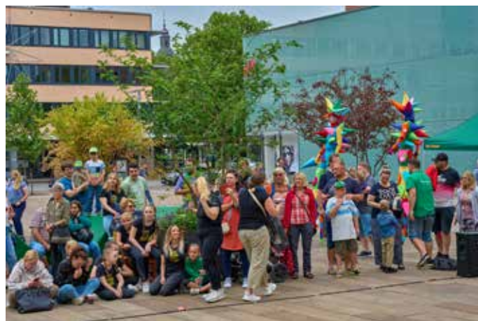
„Die Konfettis“ (Stelzenläufer) und viele Besucher am Tag der offiziellen Einweihung