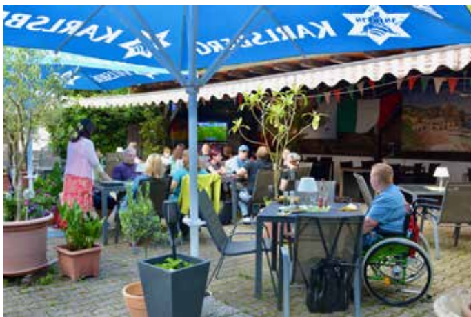
Der gemütliche Biergarten lädt zum Verweilen ein

offen. Selbstredend erwartet die Gäste auch eine große Palette an verschiedenen frisch zubereiteten Pizzen, alle mit Liebe gefertigt. Belebt sind ebenfalls die Pastagerichte, welche wahlweise mit Spaghetti, Tagliatelle oder Rigatoni angerichtet werden. Auch hier ist die Bandbreite der Zubereitung groß angefangen von Verdure (mit Gemüse nach Art des Hauses), Gorgonzola oder alla Panna, um einmal mit den einfacheren Sachen zu starten. Sehr beliebt sind die Tagliatelle mit