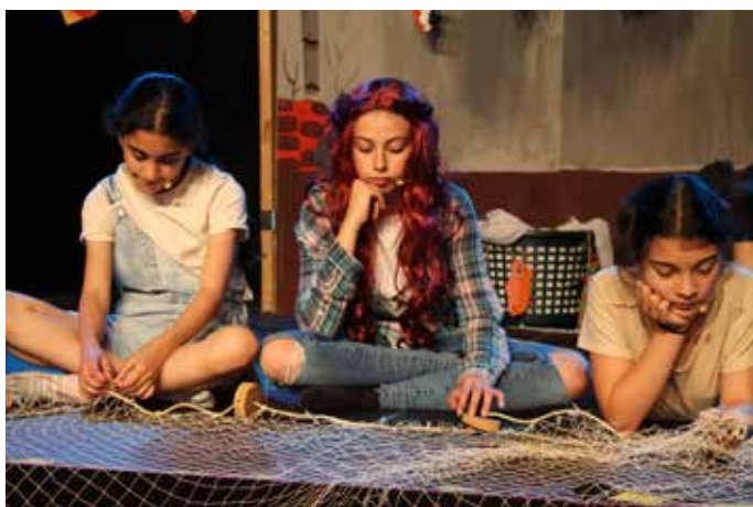
Zora und ihre Bande halten die Stadt Senj in Atem

professionelle Tontechnik und Klavierbegleitung gaben den Aufführungen den letzten Schliff. Verstärkt durch Schülerinnen und Schüler höherer Klassenstufen wuchsen die jugendlichen Akteure über sich hinaus und erlebten selber, was es bedeutet, in Gemeinschaft Großes zu schaffen. Und so stellte sich am Ende nur noch eine Frage: Was spielen wir als Nächstes? Die Schulgemeinschaft freut sich auf neue Projekte!