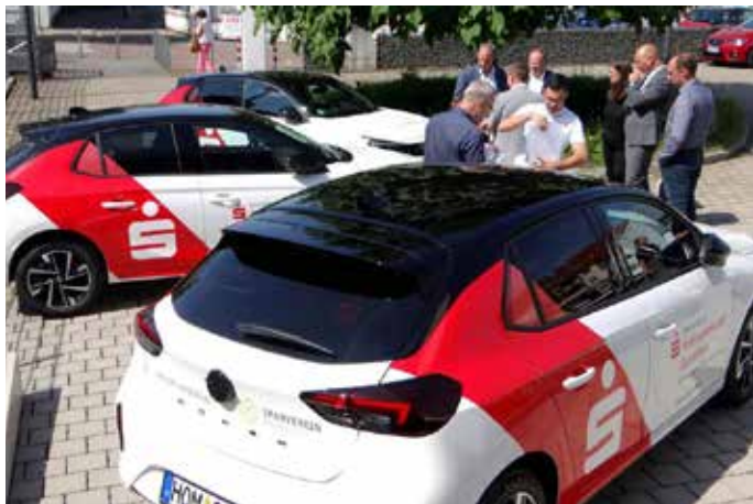
Die neuen Autos sind fortan im Straßenverkehr gut zu erkennen mit dem auffallend roten Sparkassen-Logo

ausgedrückt mit rund 27 Millionen Euro. Schwerpunkt seiner Hilfe ist die Unterstützung der Mobilen Sozialen Dienste sowie gemeinnütziger Projekte und Institutionen. Alleine im Jahr 2022 konnten saarlandweit 41 Spendenfahrzeuge im Wert von ca. 510.000,00 Euro übergeben werden, davon 4 im Saarpfalzkreis im Wert von 34.820,00 Euro. Auch die KSK Saarpfalz ist sich ihrer Verantwortung bewusst und sorgt im Sinne der guten Sache unentgeltlich für den Vertrieb der Gewinnlose und kann