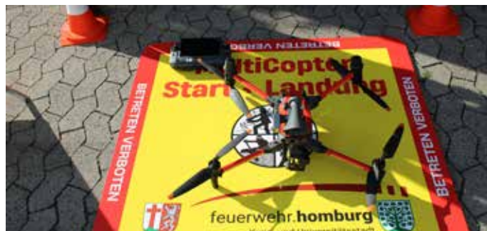
Die neue Drohne auf ihrem Landeplatz © Jürgen Kruthoff/Stadtverwaltung

die Stadtverwaltung Homburg erworben, den Innenausbau haben Angehörige des Löschbezirks Kirrberg in Eigenleistung so durchgeführt, dass dieser nicht nur die Drohne samt Zubehör transportieren kann, sondern über das gesamte Equipment verfügt, um das Fluggerät vor Ort auch steuern bzw. überwachen und die gelieferten Aufnahmen auswerten zu können. Zunächst hatte Bürgermeister Forster betont, dass er sich freue, die Feuerwehr in Homburg so gut ausstatten zu