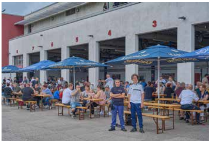
Junger Nachwuchs bei der Feuerwehr Homburg