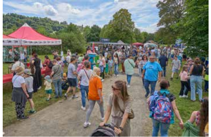
Unzählige Familien, Stände und ein prima Wetter beim 24. Homburger Kinder- und Familienfest