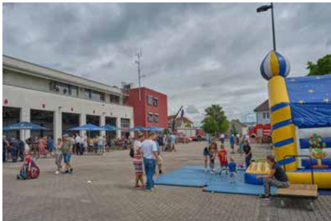
Sonntags gab es für die Kinder eine Hüftburg