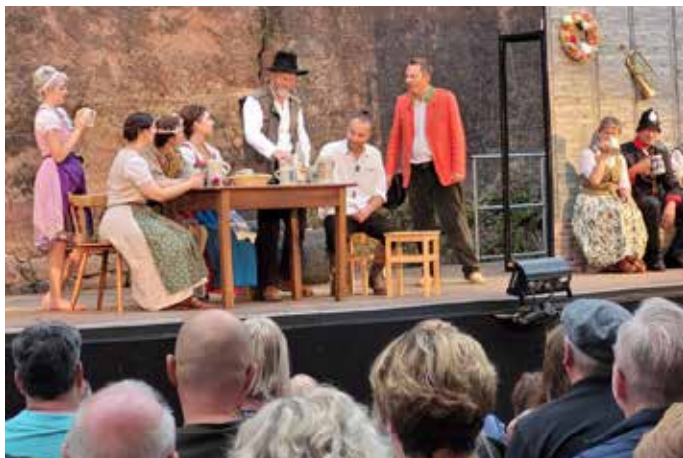
Turbulent wird es in der Schlossruine zugehen (Foto von 2023) © Diane Jochem

eine Aufführung zu schaffen, die sowohl die treuen Fans des Originals als auch neue Zuschauer begeistern wird. Die Mischung aus Humor, Emotion und Nachdenklichkeit macht das Stück zu einem besonderen Ereignis, das die Zuschauer zum Lachen und zum Nachdenken anregen wird. Ausverkaufte Vorstellungen und der immer wiederkehrende Wunsch unserer Zuschauer es erneut aufzuführen sind Beweis für