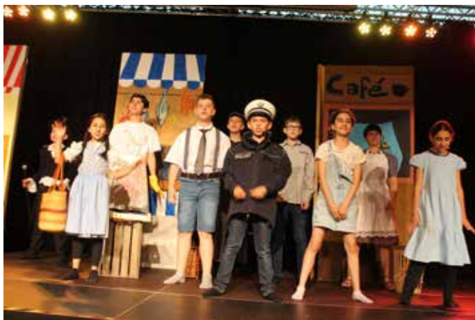
Hinter den Schülerinnen und Schülern der Klassenstufe 5 bis 7 lag eine lange Zeit des Probens und Übens