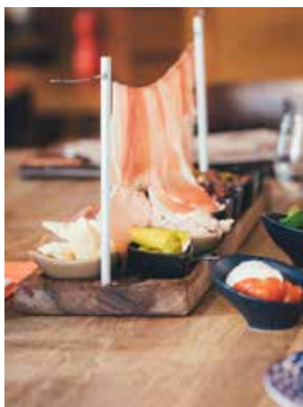
Die Antipasti-Wäscheleine ist der beliebte Vorspeisen-Klassiker im Oh!lio

den Homburgerinnen und Homburgern gut ankommt. Auch das jährlich stattfindende Weinfest mit Livemusik von Elmar Federkeil ist immer gut frequentiert. Darüber hinaus kann das Vin!oh auch für private Veranstaltungen, wie etwa Geburtstage oder andere Feierlichkeiten gemietet werden; Service und Verpflegung inklusive. Neben dem Genuss spielt auch die Kultur am historischen Marktplatz eine zentrale Rolle. So gibt es seit über zwanzig Jahren den Homburger Musiksommer, der sich, auch über die Grenzen der Stadt hinaus, großer Beliebtheit erfreut. Jedes Jahr sind hier an den Wochenenden von Ende Mai bis Anfang September musikalische Klänge unterschiedlichster Stilrichtungen zu vernehmen. Für das leibliche Wohl der Besucher sorgten dabei viele Jahre lang das spanische Restaurant Don Quichotte und ein Getränkewagen. Heute dürfen sich die Gäste auch über frisch zubereitete Pinsa, eine Art Pizzabrot, das nach dem Backen erst belegt wird, freuen, denn das Oh!lio Team ist während des Musiksommers jeden Freitag ab 18.00 Uhr mit Pinsa-Wagen und Getränkezelt vor Ort. Dass die Küche des Restaurants bis 22.00 Uhr geöffnet hat, freut dabei nicht nur die Besucher*innen des Musiksommers, sondern bietet