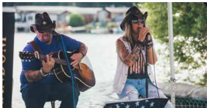
Die Musiker bei der Eröffnungs-Party