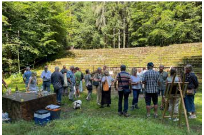
Zahlreiche Besucher:innen fanden sich an der Waldbühne ein

Sie uns diese Werke, eine Hommage an den Homburger Wald, zeigen. Passender könnte die gewählte Örtlichkeit für diese Ausstellung kaum sein“, zeigte sich auch der Bürgermeister begeistert vom gesamten Ambiente. Man merke, dass die Fläche für solche Veranstaltungen absolut geeignet sei, so Forster. Und am sehr hohen Besucheraufkommen - das neben den Werken sicher auch an der ungewöhnlichen Location lag - auch, „dass