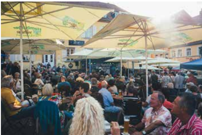
Ein voller Marktplatz, dank dem Musiksommer und dem gastronomischen Angebot

nicht kommen sehen. Umso schöner ist es, die Entwicklung zu beobachten, die der historische Marktplatz in Homburg seitdem durchlaufen hat. Die Menge an Laufkundschaft ist um ein Vielfaches gestiegen, der Markt ist zu einem Ort geworden, an dem man gerne sitzen und verweilen möchte, tagtäglich herrscht reges Treiben, was sich nicht zuletzt auch positiv für die Geschäfte der Eisenbahnstraße sowie der Saarbrücker Straße