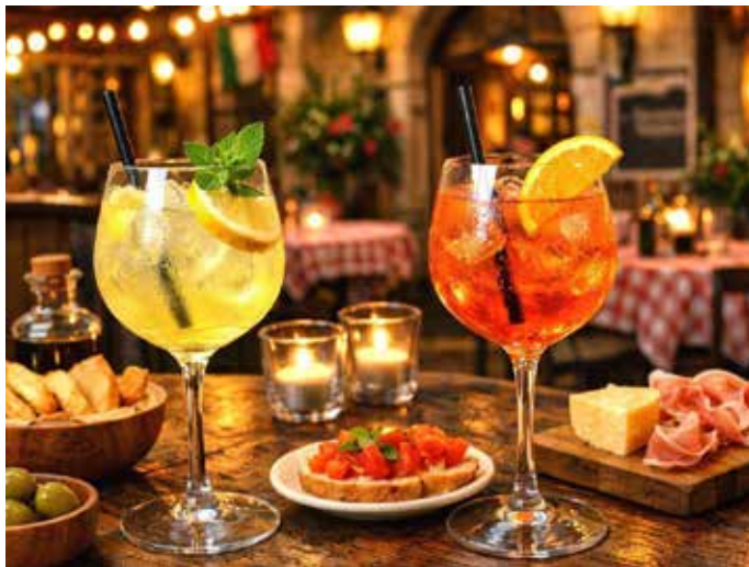
Bei Pane e Vino trifft echte italienische Esskultur auf herzliche Gastlichkeit

authentischen Rezepten und großer Leidenschaft prägt. Beide verfügen über langjährige Erfahrung in der Gastronomie und waren zuvor viele Jahre im Weihertal in Kirkel am Tennisclub tätig, wo sie sich bereits einen Namen gemacht haben. Seit Mai 2026 führen sie nun das Pane e Vino in den Räumlichkeiten des ehemaligen Bliesberger Hofs und bringen ihre Erfahrung sowie ihre persönliche Handschrift in das Restaurant ein. Ein besonderes Highlight ist das eigene Olivenöl aus familiärem Anbau in Kalabrien – ein Stück Heimat, das sich in vielen Gerichten wiederfindet. Verarbeitet werden ausschließlich ausgewählte, hochwertige Zutaten und italienische Produkte, um ein authentisches Geschmackserlebnis zu bieten. Die rustikale Einrichtung mit ihren warmen Holztönen und dem gemütlichen Landhausstil ist bewusst erhalten geblieben. Viele ehemalige Stammgäste des Bliesberger Hofs können sich sofort wieder zuhause fühlen. Besonders viel getan hat sich