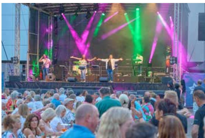
„Vulcano“ – Italo Hits Live

Dazwischen das unermüdliche Summen der Menschenmengen, die sich aber besuchertechnisch auch eher im Rahmen hielten. Doch wer genau hinsah, der entdeckte hinter den offiziellen Jubelhymnen auch jene kleinen, liebgewonnenen wie bitteren Unzulänglichkeiten, die unser Homburg erst so herrlich menschlich machen. Diesmal waren es auch leider keine drei Musikbühnen, wie sonst gewohnt und wie auch auf den Baustellenzaun-Werbetransparenten zu lesen stand. Die