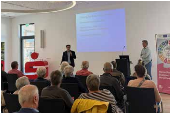
Die Veranstaltung war sehr gut besucht