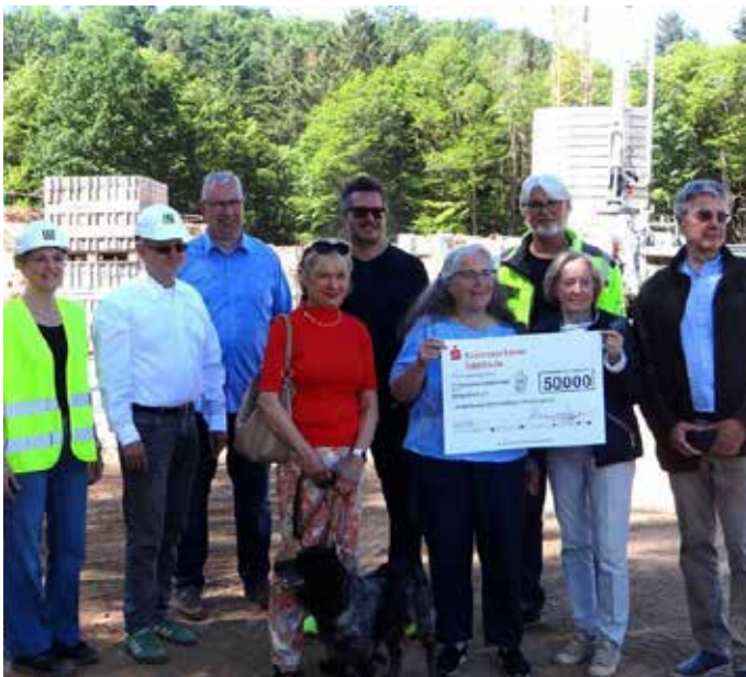
Eine stattliche Spende über 50.000 Euro überbrachte der Förderverein Kinderhospiz Saarland aus Bous

Begrüßung der Anwesenden. Er machte aber auch deutlich, dass die Finanzierung eine dauerhafte Aufgabe sei. Bei dem Bauprojekt geht es nicht um Glanz und Großspürigkeit, sondern um einen Neubau auf dem Gelände des Uniklinikums: das neue Kinder- und Erwachsenenhospizzentrum Schmetterling.