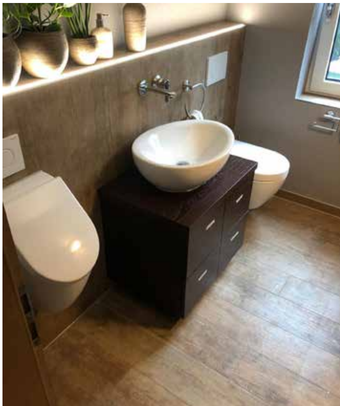
Nur ein Beispiel einer gelungenen Badsanierung

Von ebenerdigen Duschen über rutschhemmende Böden bis hin zu ergonomischen Waschtischen und intelligenten Raumkonzepten – die Experten beraten direkt vor Ort und entwickeln individuelle Pläne, die langfristig Sicherheit und Lebensqualität erhöhen. Auch im Bereich Altbausanierung verfügt die Simon Alois GmbH über umfassende Erfahrung. Viele Häuser im Saarpfalz-Kreis sind älter und benötigen eine behutsame Modernisierung, die sowohl die bestehende