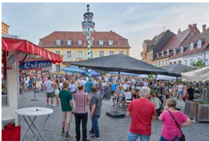
Der Homburger Marktplatz beim 50. Maifest

dem bewährten Kontrastprogramm: Hier eine krachende Rock'n'Roll-Party mit „Krüger rockt!“ auf dem Marktplatz, dort südländische Sehnsuchtsklänge mit „Vulcano“ auf dem Christian-Weber-Platz. Des Weiteren spielten an drei Tagen