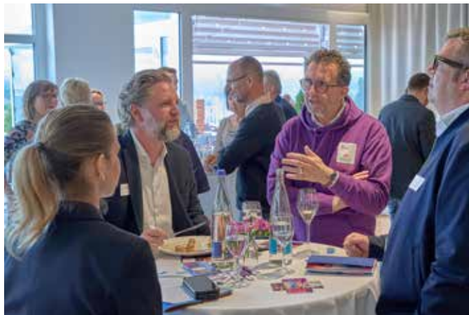
Reinhold Jost, Minister für Inneres, Bauen und Sport (hier im lilafarbenen Hoodie) war auch zugegen

mittendrin wird im Juni zum pulsierenden Herzschlag dieses wunderbaren, größten inklusiven Multisport-Events Deutschlands. Laut Homburgs Bürgermeister Manfred Rippel geht es hier nicht um bloße Pflichttermine. „Für Homburg war schnell klar, dass wir nicht nur Austragungsort sein möchten, sondern auch Teil des Host-Town-Programms werden wollen“, betonte er sichtlich stolz. Es geht um Werte, die uns allen am Herzen liegen: Teilhabe, echte Begegnung auf Augenhöhe und ein Zusammenhalt, der nicht nur auf dem Papier existiert,