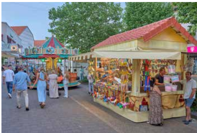
Szene in der Talstraße beim 50. Homburger Maifest