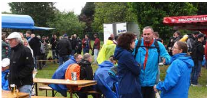
Leckerbissen nach original römischem Rezept, darunter lukanische Würste und dazu Licorne-Bier waren zum Abschluss der Renner

wo im „Prinzenpark“ die nächste Station zum Verweilen einlud. Der dortige Förderverein Kultur und Brauchtumpflege hatte allerhand Leckeres und Musikalisches im Angebot. Es spielten „The Two + more“. Von hier führte ein attraktiver Wanderweg durch ein kleines Waldgebiet. Im so genannten Jammertal war dann am Dibelius Hof ein weiterer Zwischenhalt eingerichtet mit hellem Kellerbier vom Fass als spezielle Biersorte sowie mit Schwenkern und Würsten. Nach einem weiteren Anstieg führte die Wegstrecke zur Ski- und Wanderhütte Kirrberg. Auch dort kamen die durstigen und hungrigen Wanderleute voll auf ihre Kosten. Dazu Akustikgitarrensound und Gesang von Mat Klahm. Über die Höhenzüge ging es dann wieder nach Westen