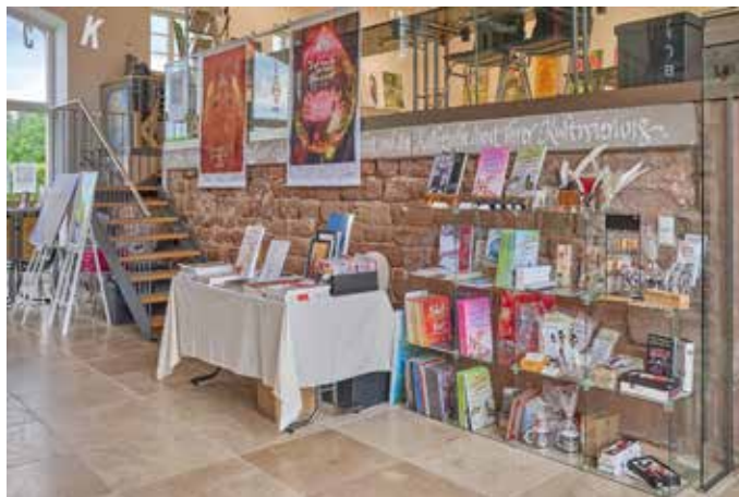
Der Vorraum im Gut Königsbruch beim eingetragenen Verein „Stiftung Schriftkultur e.V.“

hierher kommt, lässt die Hektik der Welt augenblicklich hinter sich. 1766 von Christian IV. von Dänemark und Norwegen gegründet und eng mit der Historie unserer Region verwoben, drohte das geschichtsträchtige Anwesen einst zu verfallen. Doch dank einer liebevollen Sanierung strahlt es seit einigen Jahren erneut in altem Glanz. Heute teilt sich die Idylle ein