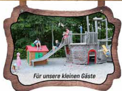
Für unsere kleinen Gäste