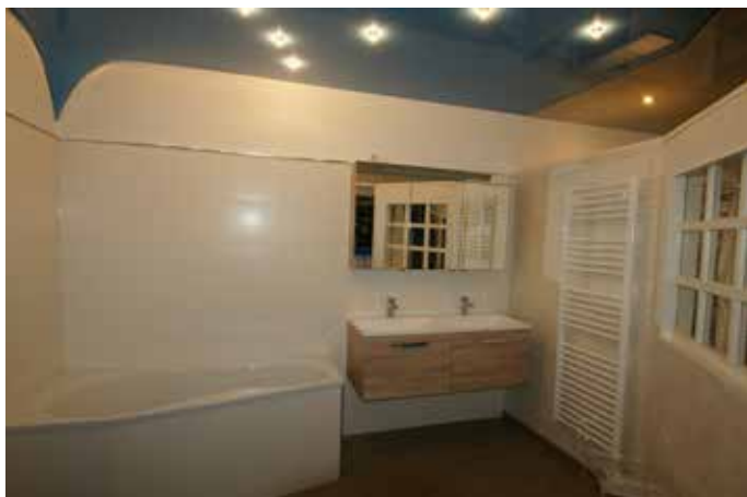
Ein Badezimmer, so richtig zum Wohlfühlen

Von ebenerdigen Duschen über rutschhemmende Böden bis hin zu ergonomischen Waschtischen und intelligenten Raumkonzepten – die Experten beraten direkt vor Ort und entwickeln individuelle Pläne, die langfristig Sicherheit und Lebensqualität erhöhen. Auch im Bereich Altbausanierung verfügt die Simon Alois GmbH über umfassende Erfahrung. Viele Häuser im Saarpfalz-Kreis sind älter und benötigen eine behutsame Modernisierung, die sowohl die bestehende