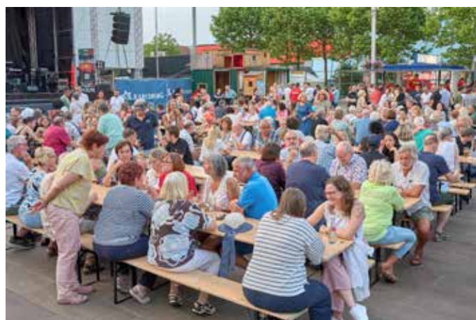
Das Publikum vor der Bühne auf dem-Christian-Weber-Platz

Alle Angaben ohne Gewähr. Änderungen vorbehalten. Agentur für Haushaltshilfe GmbH Sperberweg 6a · 41468 Neuss