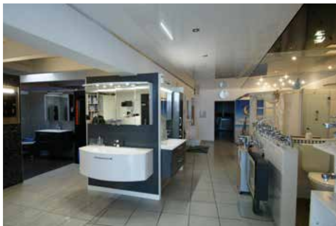
Ein Blick in die großzügige Ausstellung zu werfen lohnt sich allemal

Bausubstanz respektiert als auch moderne Technik integriert. Das Unternehmen verbindet traditionelle Handwerkskunst mit zeitgemäßen Lösungen und sorgt dafür, dass alte Gebäude energetisch, funktional und optisch auf den neuesten Stand gebracht werden. Neben dem Sanitärbereich ist die Simon Alois GmbH ein ausgewiesener Fachpartner für moderne