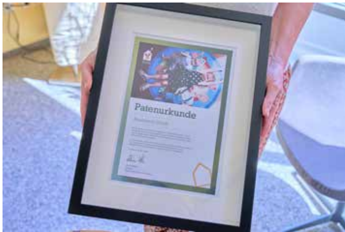
Die Patenerkennung der Amapharm GmbH (für Apartment 13)