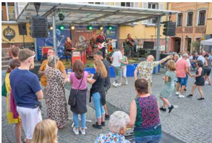
Die Kombo „Krüger rockt!“ spielte Oldies und herrlich tanzbares Liedgut

Dazwischen das unermüdliche Summen der Menschenmengen, die sich aber besuchertechnisch auch eher im Rahmen hielten. Doch wer genau hinsah, der entdeckte hinter den offiziellen Jubelhymnen auch jene kleinen, liebgewonnenen wie bitteren Unzulänglichkeiten, die unser Homburg erst so herrlich menschlich machen. Diesmal waren es auch leider keine drei Musikbühnen, wie sonst gewohnt und wie auch auf den Baustellenzaun-Werbetransparenten zu lesen stand. Die