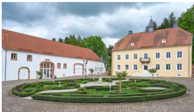
Das Gut Königsbruch in Bruchhof