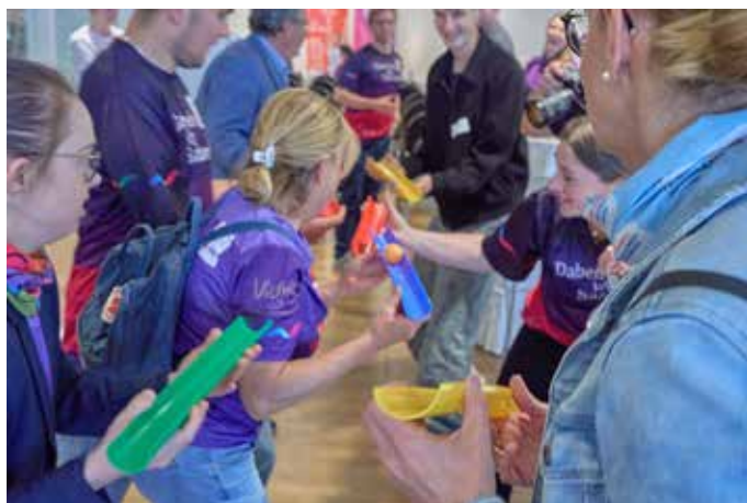
Ein rasantes Ballspiel verlief immer wieder quer durch den ganzen Raum!