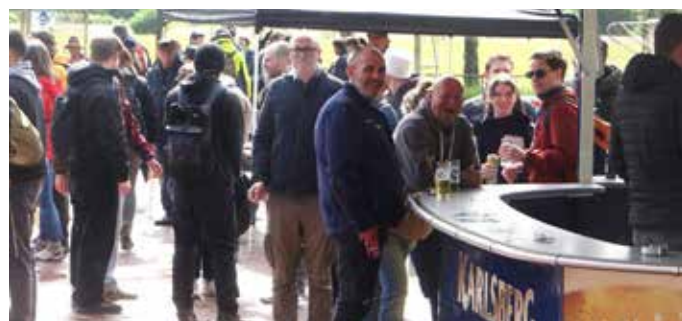
Startpunkt war am Sportplatz der TuS Wörschweiler. Von hier aus ging es weiter nach Einöd