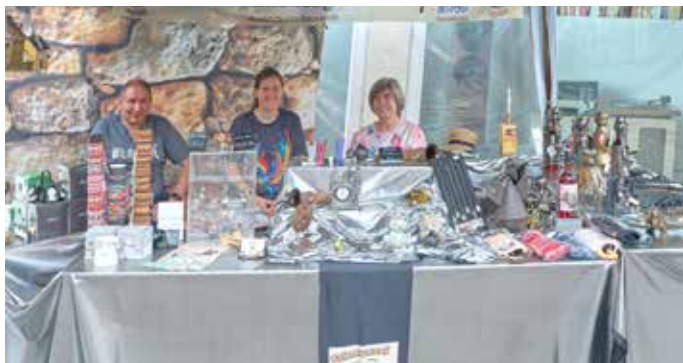
Der Krammarkt-Stand von „Schmunzelpuhl“ mit Geschenken zum Schmunzeln