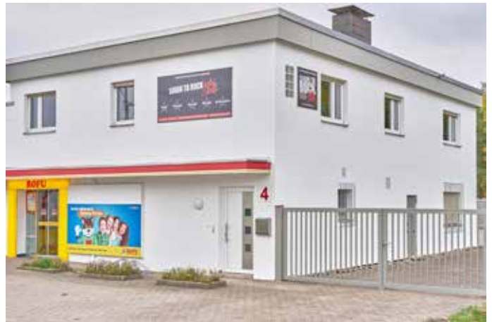
Die Außenansicht der Learn to Rock Music School in den Homburger Rohrwiesen Nr.4 (direkt neben ROFU Kinderland)

auf Bühnen oder in professionellen Musikprojekten unterwegs. Dieses Wissen geben sie direkt an ihre Schülerinnen und Schüler weiter. Dank des starken Netzwerks der Learn-to-Rock-Familie profitieren die Musikbegeisterten in Homburg zudem von besonderen Angeboten und Kontakten innerhalb