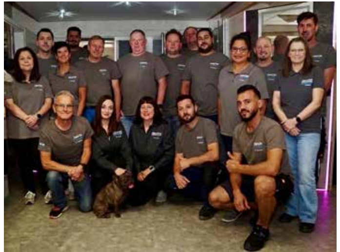
Mit einem engagierten Team bietet die Simon Alois GmbH einen umfassenden Kundendienst

seit vielen Jahren im Sanitärbereich tätig und versteht es, individuelle Wünsche in stimmige Raumkonzepte zu verwandeln. Besonders beeindruckend ist die Möglichkeit, das zukünftige Bad in 3D zu planen. So entsteht ein realistischer Eindruck, der Entscheidungen erleichtert und Planungssicherheit schafft. Von der ersten Idee bis zur fertigen Wohlfühlloase liegt bei der Simon Alois GmbH alles in einer Hand. Nach einem kostenlosen und unverbindlichen Kostenvoranschlag übernimmt das Team die komplette Umsetzung – zuverlässig, sauber und termintreu. Ob Komplettbad oder Teilrenovierung, ob modernes Design oder funktionale Anpassung: Die Arbeiten werden so koordiniert, dass Kunden ihr neues Bad innerhalb weniger Tage nutzen können. Ein besonderer Schwerpunkt