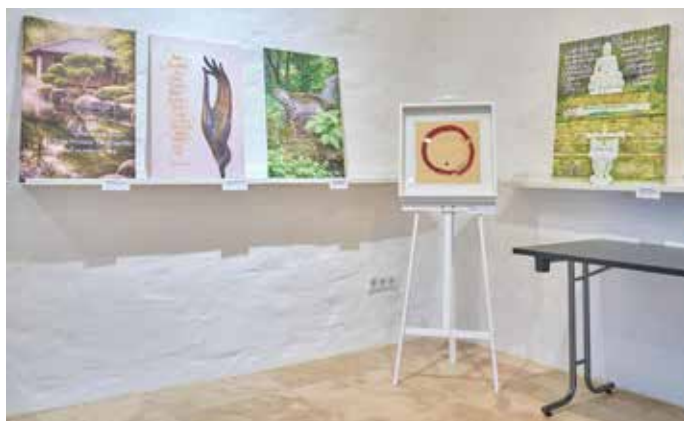
Fernöstlich anmutende Textkunst mit farbprächtigen Hintergrundmotiven sind zur Zeit in der Ausstellung

feine Leinwanddrucke, die ausdrucksstarke Pinselstriche mit asiatisch anmutenden Naturfotografien verbinden – atmen den Geist des Zen-Buddhismus und des Taoismus. Der zentrale buddhistische Leitgedanke „Leere ist Form und Form ist Leere“ zieht sich wie ein roter Faden durch die Räume. Das Faszinierende an Frau Piepers Arbeiten ist ihre trügerische Mühelosigkeit. Was auf den Betrachter wirkt wie ein flüchtiger, eleganter Moment, ist das Ergebnis jahrzehntelanger Disziplin. Sie selbst vergleicht es gern mit dem Eiskunstlauf: Die Tänzer gleiten scheinbar schwerelos über das Eis, drehen sich voller Selbstverständlichkeit – und doch steckt dahinter harte,