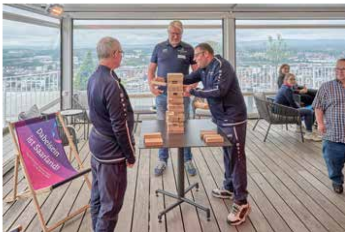
Auch er will bei der Olympiade hoch hinaus!

finden kann. (Anmerkung der Redaktion). Man wird aufzeigen, wie offen und herzlich die Menschen hier bei uns im Saarland sind. Dass das prächtig funktioniert, hat übrigens schon das erste inklusive Sportfest im Sportzentrum Erbach bewiesen, wo die Kids der Grundschulen Langenäcker und Luitpold zusammen mit den Förderschulen Oberlin und Siebenpfeiffer