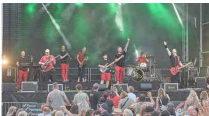
Die Konsorten spielten am Samstagabend auf dem Christian-Weber-Platz