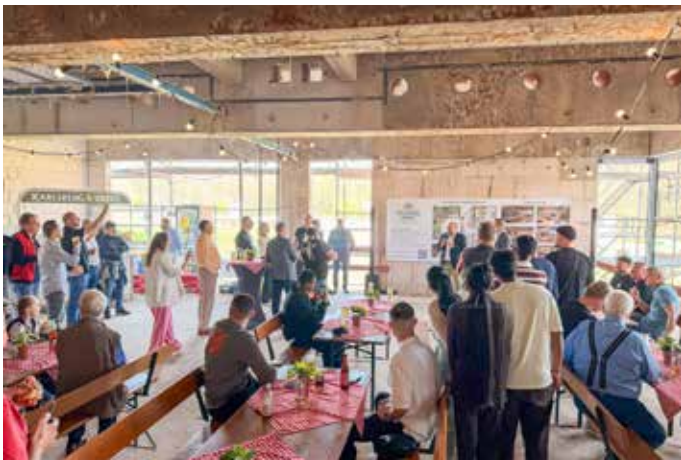
Die Gäste bei der Rede des Bürgermeisters.