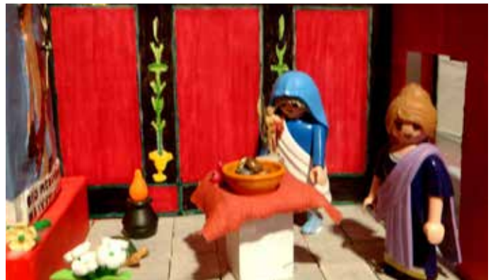
Man kann sich anhand der Arrangements auch das zivile Leben der Römer vorstellen