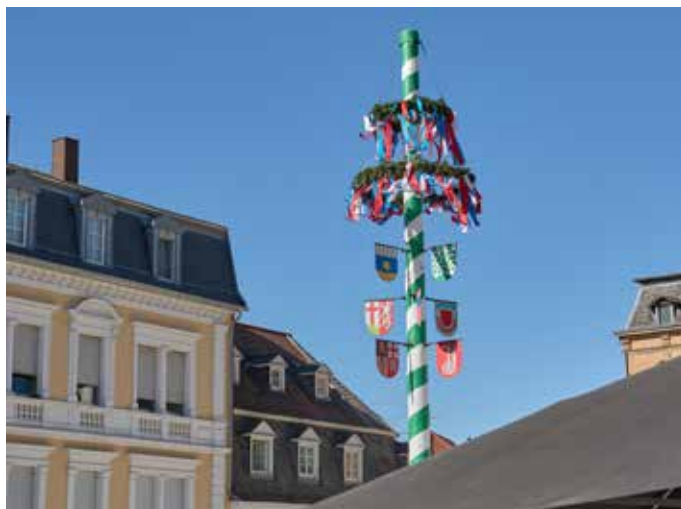
Der Maibaum