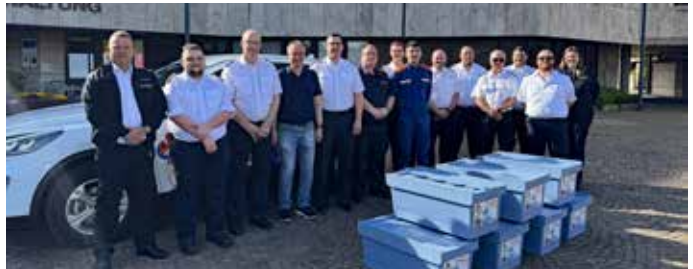
Übergabe der Experimentenkoffer für die Jugendfeuerwehren im Saarpfalz-Kreis an die Wehrführer in den Kommunen