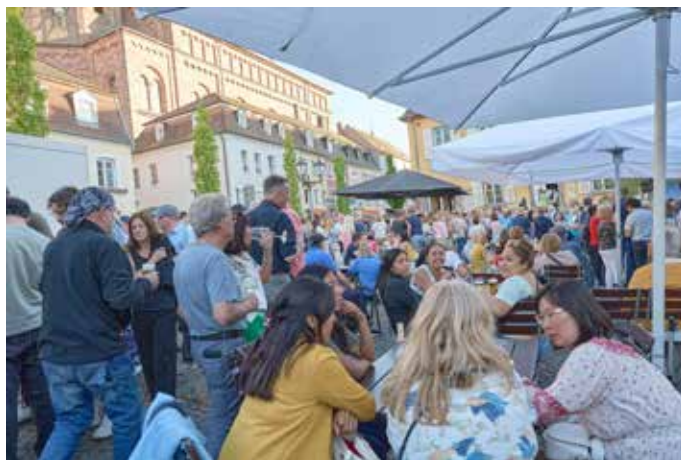
Überall Leute, Leute und nochmals Leute!