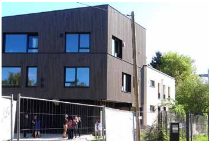
Der Neubau der Stadtentwässerung von außen betrachtet