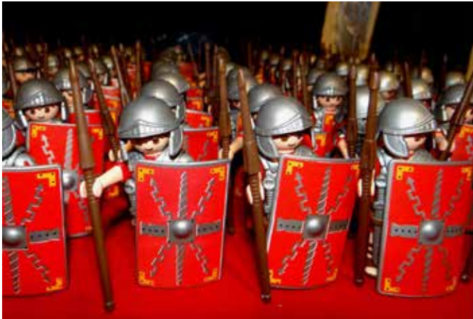
Auch die römische Armee ist in der Ausstellung eindrucksvoll vertreten

Eindrucksvolle Ausstellung, die Geschichte auf lebendige Weise erlebbar macht