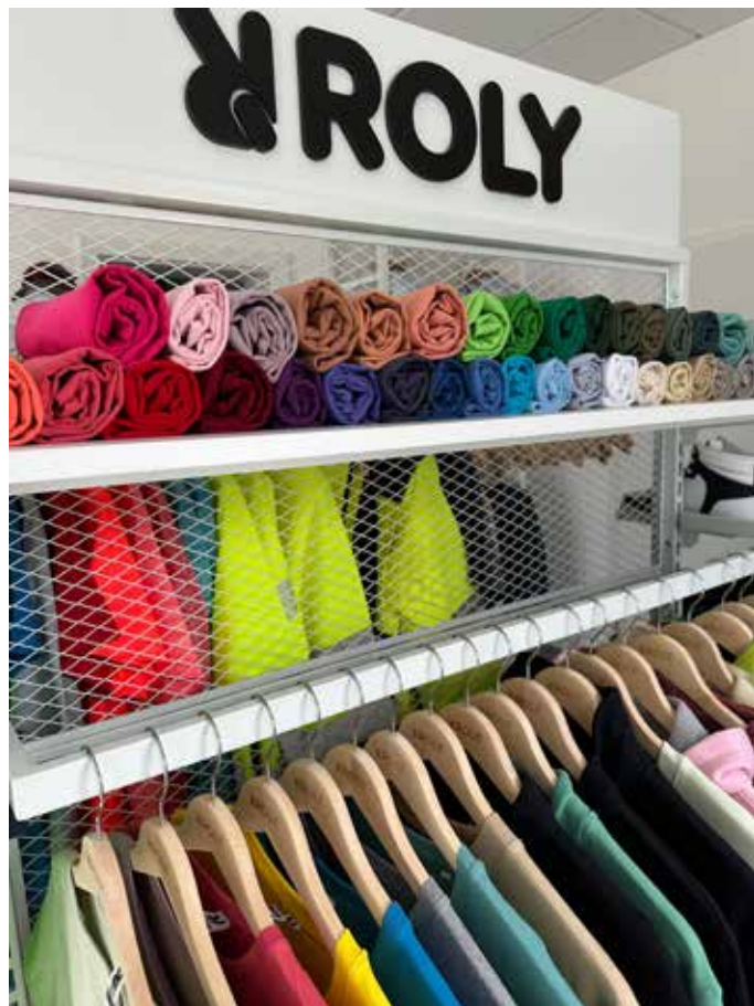
Besuchen Sie den Showroom in Kaiserslautern