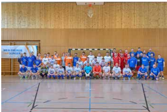
Alle sechs Stadtwerke-Fußballmannschaften in der Lambsbachhalle in Kirrberg