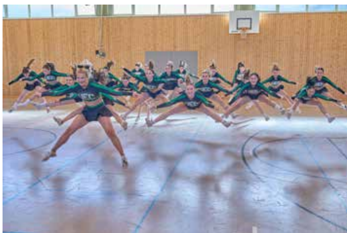
Die Emeralds Cheerleader präsentierten in der Fußball-Halbzeit eine tolle Showeinlage