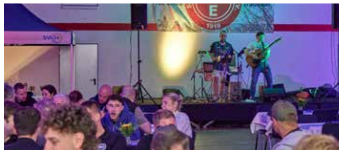
Das Saarbrücker Duo „Theke 1“ sorgte für den musikalischen Party-Hintergrund