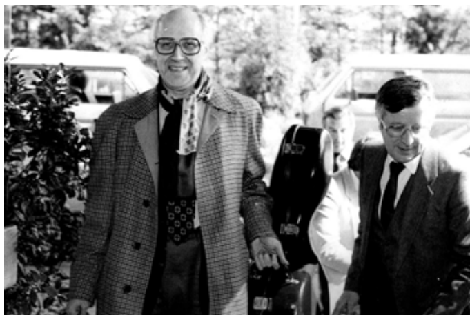
Der international bekannte Cellist Rostropowitsch bei der Ankunft im damaligen Homburger City-Park Hotel, rechts im Bild der damalige Homburger Verkehrsdirektor Hugo Breit

1983 gastierte der weltberühmte Musiker im Saalbau Homburg und begeisterte das Publikum im Rahmen der „Homburger Meisterkonzerte“ mit seiner außergewöhnlichen Ausdruckskraft