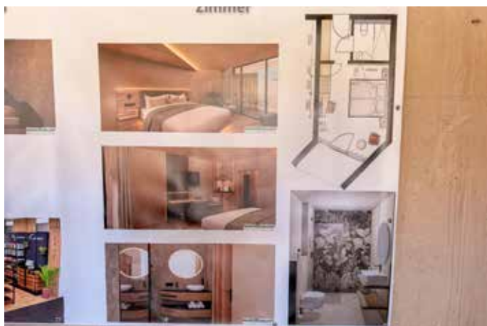
Die Zimmer werden modern und komfortabel ausgestattet.

zu einem neuen Wohn- und Aufenthaltsort entwickeln. Bereits bei der Vorstellung der Pläne war von einem Wohnpark die Rede, der modernen Wohnraum, Hotellerie und eine attraktive Umgebung miteinander verbinden soll. Neben dem Hotel sind weitere Wohnangebote vorgesehen – ein Vorhaben, das für Bexbach zusätzliche Impulse bringen kann. Auch für die Stadt ist die Entwicklung von Bedeutung. Ein lange leerstehendes Gelände wird wieder genutzt, touristische Angebote werden