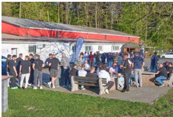
Nach der Ankunft aller Mannschaften auf der Eichheck bei der Sportgemeinde Erbach