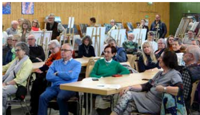
Das Publikum war gefesselt von dem leidenschaftlichen Vortrag des tollen Schauspielers

Jetzt Werkstatttermin vereinbaren! → Telefon: 06841 - 93 45 610 www.autohaus-suessdorf.de