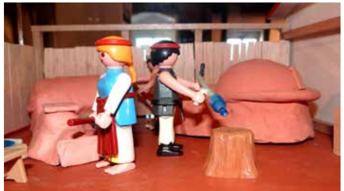
Mehr als 50 Szenarien schaffen eine ebenso fundierte wie spielerische Annäherung an die römische Geschichte

aufwendig gestalteten Dioramen erwachen Alltagssituationen aus der Römerzeit zum Leben: Händler preisen ihre Waren an, Familien gehen ihren täglichen Beschäftigungen nach, und Handwerker zeigen ihr Können. Jede Szene ist sorgfältig arrangiert, jede Figur trägt die passende Kleidung,