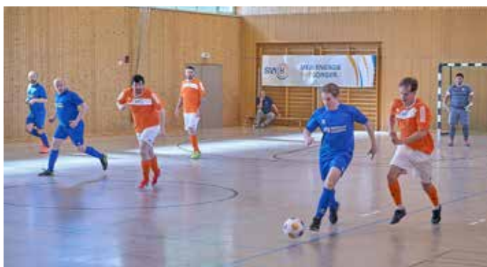
Die Homburger Stadtwerke (hier in Orange) erreichten den 3. Platz

Homburg Mitarbeiter des Personalmanagements, agierte für dieses Turnier als sportlicher Leiter. Er meinte nach dem Turnier: „Mit einer insgesamt starken Teamleistung konnten wir uns beim Hallenturnier einen verdienten 3. Platz sichern. Von Beginn an zeigten alle Mannschaften Einsatzbereitschaft und eine gute Leistung auf dem Feld, die im Laufe des Turniers immer besser wurde.“ Er betonte, dass der Teamgeist aller Mannschaften besonders positiv zu spüren und förmlich