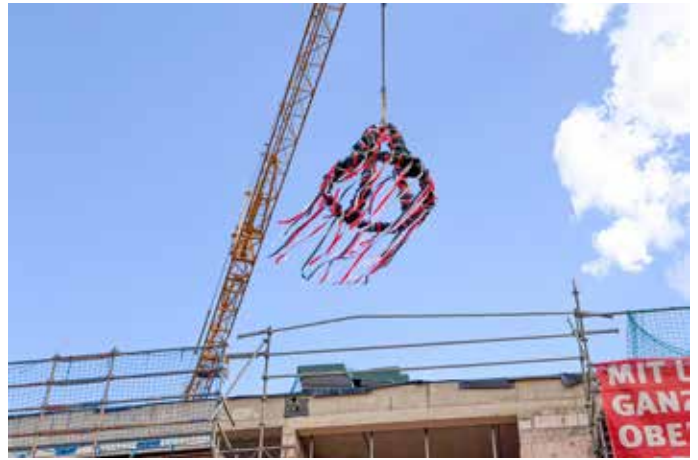
Der Richtkranz des neuen Hotels.