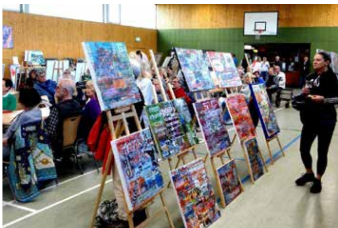
In typischer Sporthallenatmosphäre waren die zahlreichen Kunstwerke an improvisierten Galeriewänden präsentiert