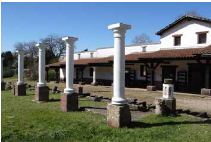
Der Besuch der Ausstellung lässt sich ideal mit einem Rundgang durch die beeindruckende Außenanlage des Römermuseums verbinden

Im Jahr 2023 war die Playmobil-Sonderausstellung schon einmal in Schwarzenacker zu sehen und begeisterte damals schon die großen und kleinen Besucher. Gleich beim Betreten des Ausstellungsraumes im Obergeschoss des Edelhauses wird klar, wie viel Herzblut in dieser Ausstellung steckt. In