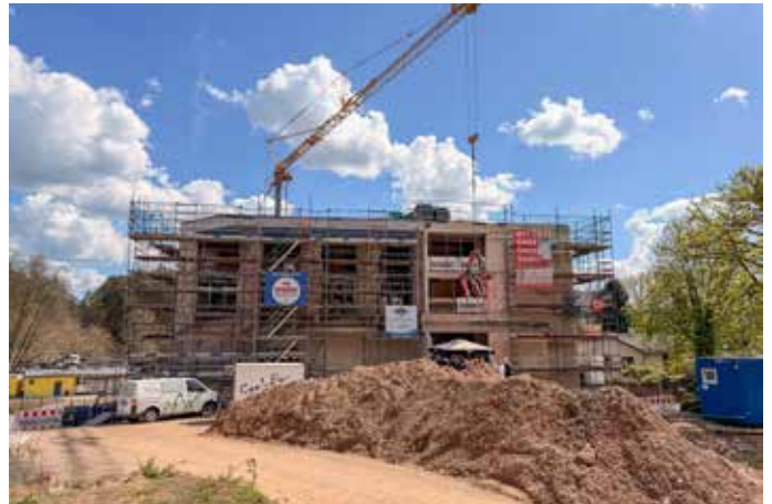
Das Hotel wächst schnell.

Angeboten in Homburg bringt er viel Erfahrung aus Hotellerie und Gastronomie mit. An der Hochwiesmühle möchte er jedoch nicht einfach Vergangenes kopieren, sondern den Standort neu denken: zeitgemäß, hochwertig und passend zur Lage am Rand von Bexbach. Geplant sind 32 großzügige Zimmer, darunter Familienzimmer und Juniorsuiten. Auch Balkone, moderne Ausstattung, Klimatisierung und ein Wellnessbereich mit Panorama-Saunen gehören zum Konzept. Ein klassisches Restaurant soll es nach den bisherigen Planungen nicht geben; stattdessen liegt der Fokus auf Übernachtung, Frühstück,