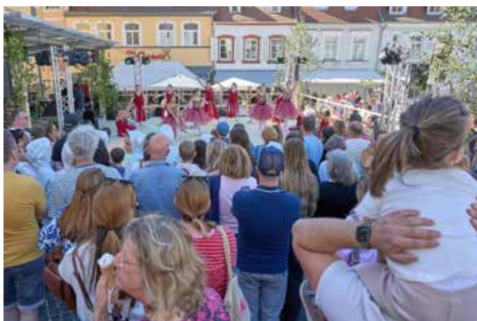
Vorführung der Tanzmanufaktur Limbach auf der großen Tanzbühne