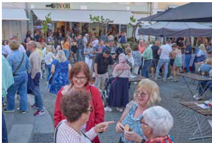
Ein Blick vom Brunnen aus auf das „Vin!Oh“