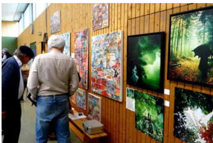
Auch an den Hallenwänden der Beeder Sporthalle waren die Gemälde präsentiert