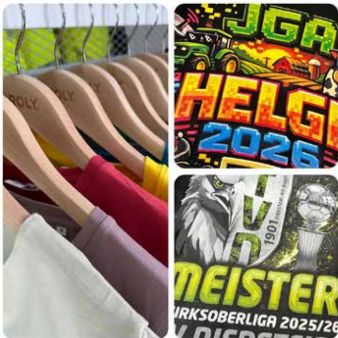
T-SHIRT BUDDIES, Ihre Inspiration für individuellen Textildruck

Genau hier zeigt sich, wie entscheidend Flexibilität und regionale Produktion sein können. Denn während viele Anbieter auf standardisierte Abläufe und längere Lieferzeiten angewiesen sind, setzen die T-SHIRT BUDDIES aus Kaiserslautern auf schnelle, direkte Lösungen vor Ort. Das Unternehmen produziert Textilien mit modernen Druckverfahren wie DTG (Direct-to-Garment) und DTF (Direct-to-Film). Der große Vorteil: Sowohl Einzelstücke als auch größere Auflagen lassen