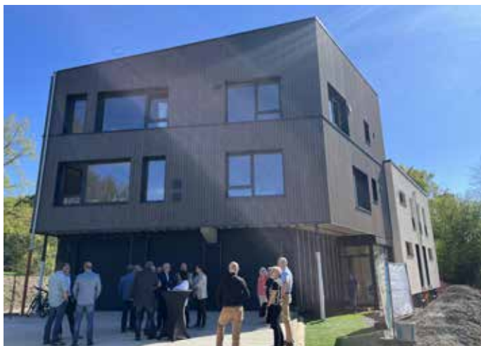
Modern und nachhaltig: Das fertiggestellte Betriebsgebäude der Stadtentwässerung Homburg