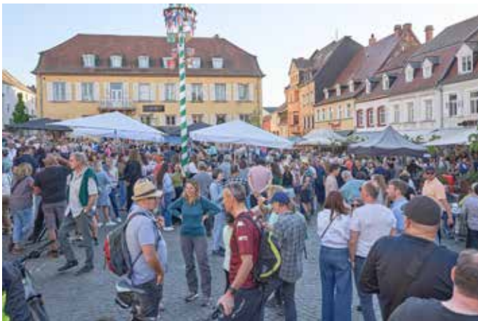
Der historische Marktplatz am 1. Mai 2026