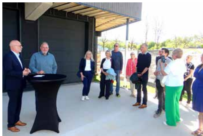
Zahlreiche Gäste aus Rat, Verwaltung und Vertreter der beteiligten Firmen waren zur Einweihung des Neubaus gekommen

die Planung und in die Umsetzung. Dieses Vertrauen haben wir erfahren.“ Das Ergebnis ist ein Gebäudekomplex, der sich in drei Bereiche gliedert: das sanierte ehemalige Klärwärterhaus aus den 1950er-Jahren, ein zentraler Treppen- und Aufzugsbereich als eigener Brandabschnitt sowie ein moderner Neubau in CLT-Holzbautechnik. Insgesamt entstanden rund 600 Quadratmeter für Büro- und Laborflächen, Sozialbereiche sowie spezielle Funktionsräume für den Kanalbetrieb. Großen Wert legte