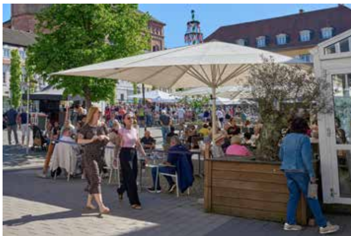
Der Marktplatz beim Tanz im Mai-Event