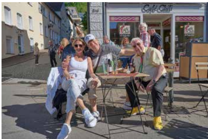
Diese drei hatten sichtlich ihren Spaß